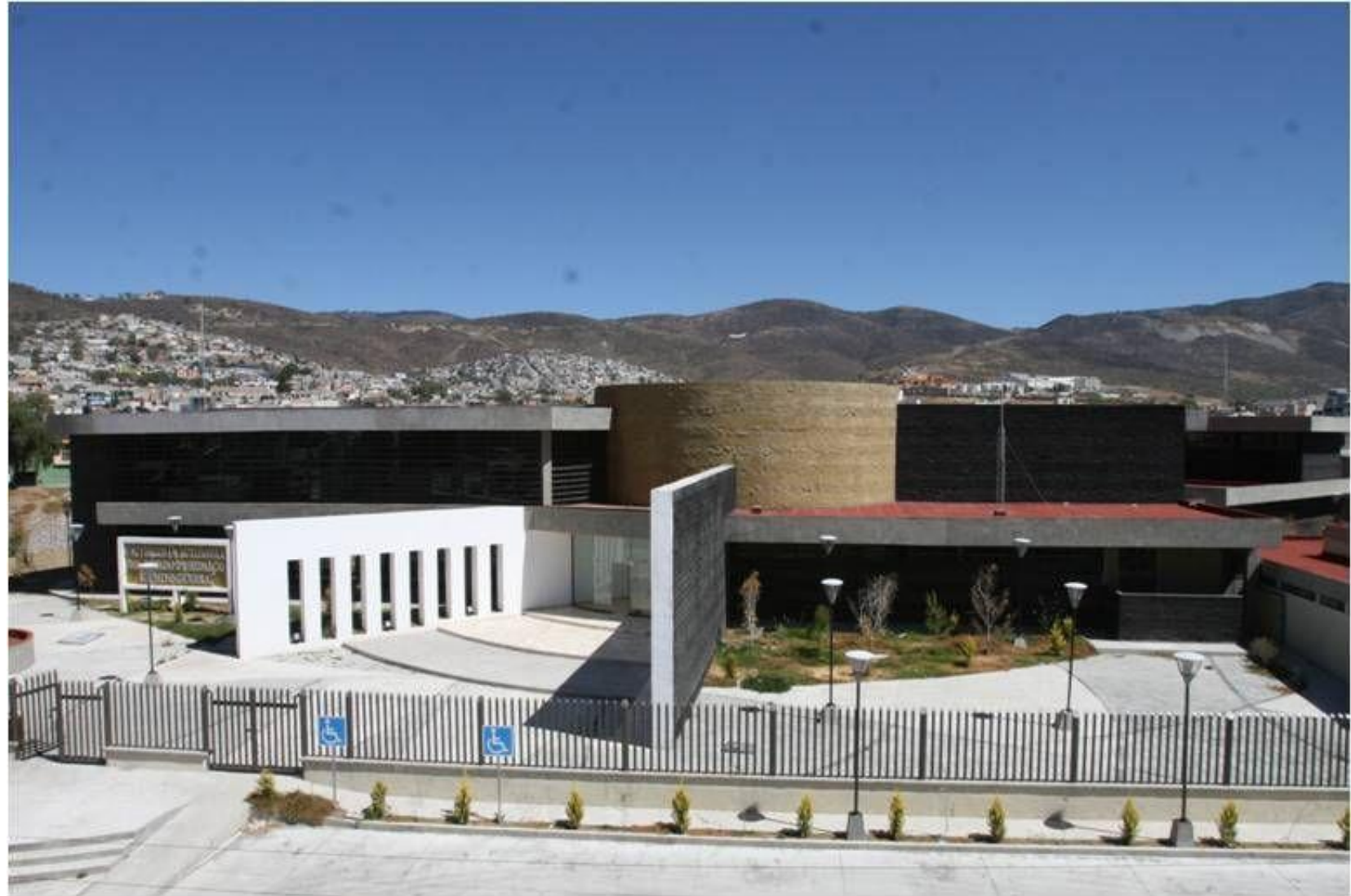
INSTALACIONES DE NUESTRO ARCHIVO