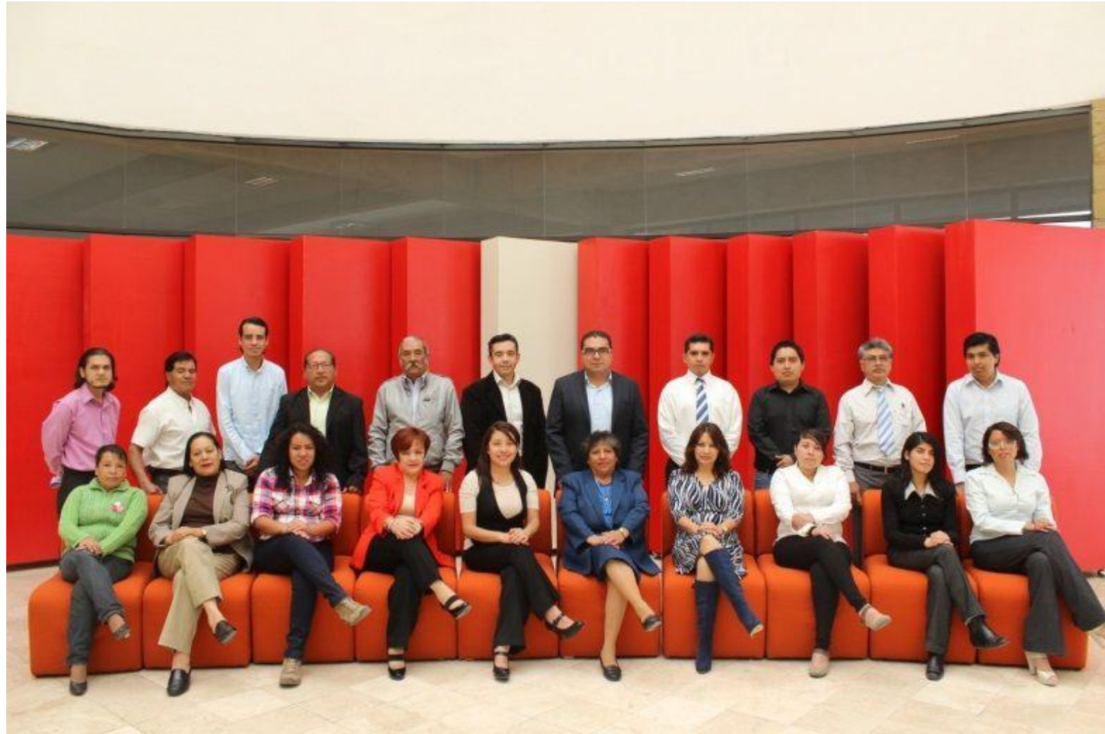
EQUIPO DE TRABAJO