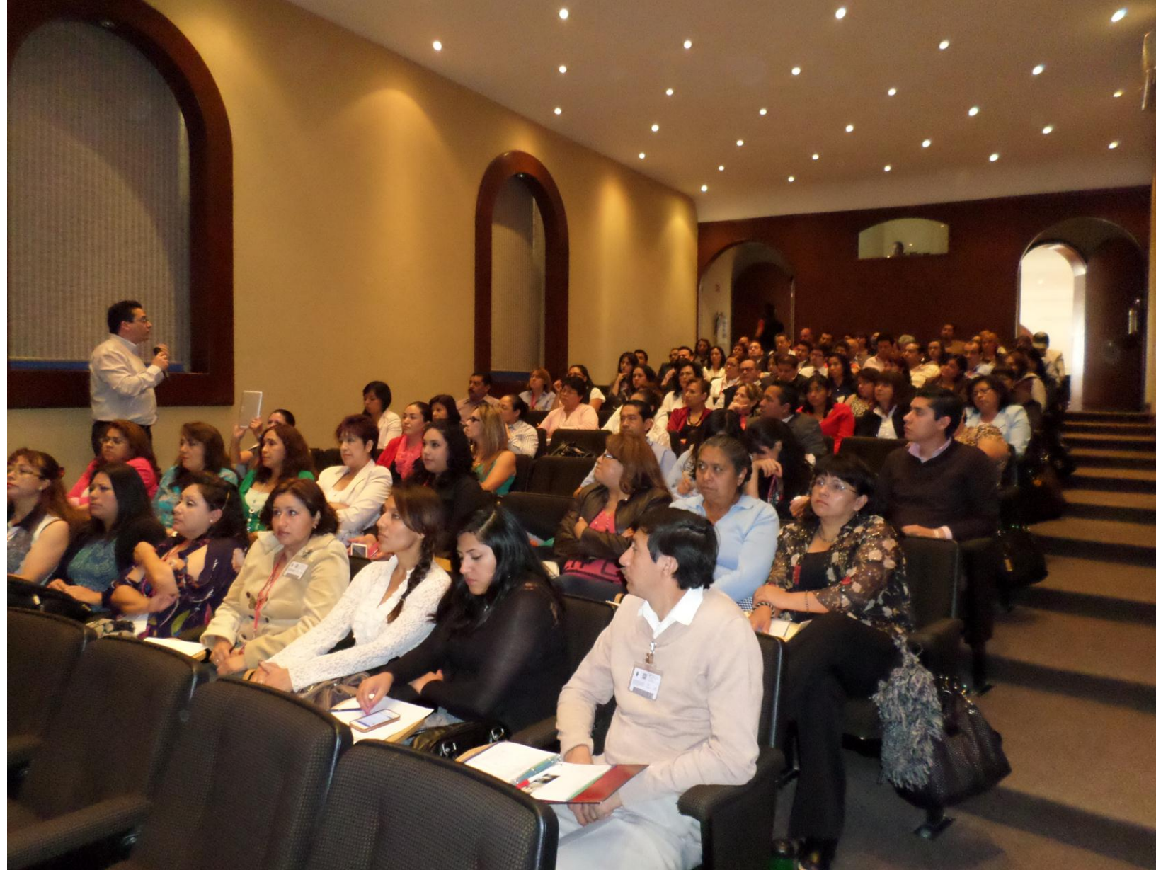
Capacitación en XV Jornadas Archivísticas de la RENAIES