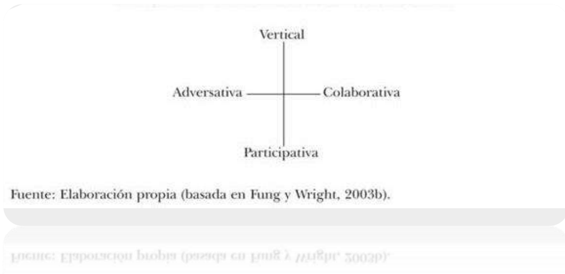
Grafica n°2 componentes de política publica

Ante una serie de intereses empresariales la tecnología ayuda a la mejora de los canales en la producción de bienes, de información, comunicación. Así como, la deliberación y participación de los ciudadanos en la toma de decisiones públicas, fundamentales para producir y reproducir el modo de vida de los individuos, es decir, para su inclusión en la sociedad. De tal modo, que el cambio social y la democracia son compañeros solo en la sociedad que los produce a través de dos instrumentos encontrados: el mercado y la política.