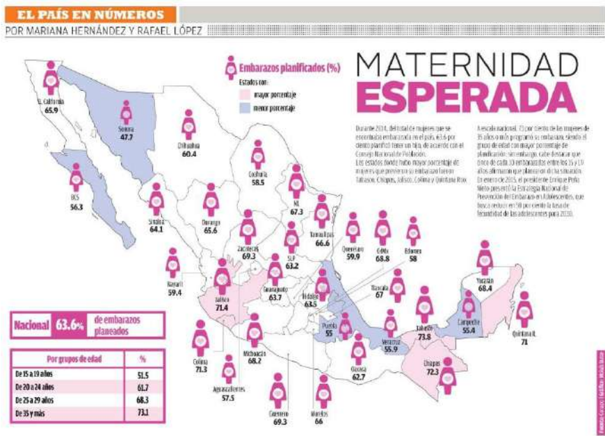
Esquema 2 Prácticas reproductivas en México: Maternidad esperada

Estos datos reflejan un escenario importante en términos del comportamiento social y económico de las nuevas generaciones, al mostrar el comportamiento en términos de la