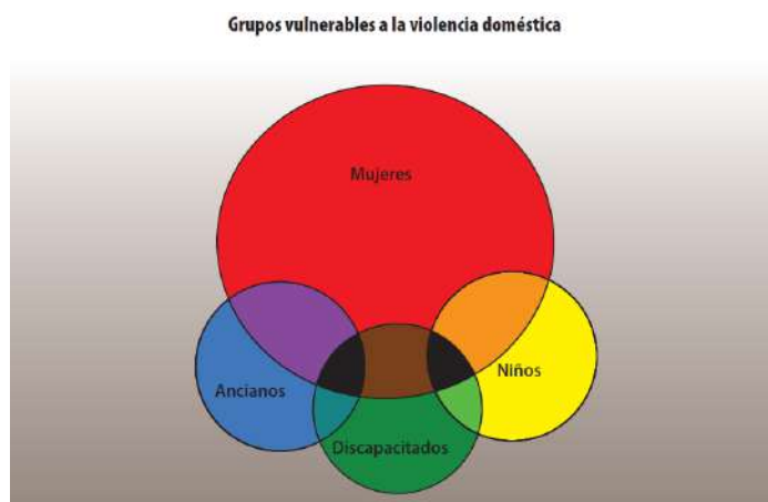
Figura 1.

ancianos y discapacitados, y con un alto nivel, ya que como se mira la distribución, el círculo rojo -mujeres- tiene un tamaño triplicado al de los otros círculos –grupos-.