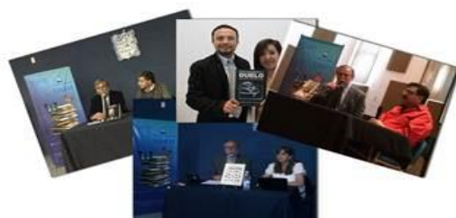
Con ustedes...los libros y sus autores

Durante el periodo que se informa, de forma presencial y a través de la plataforma de videoconferencia se llevó a cabo el programa Con ustedes...los libros y sus autores , realizando 61 presentaciones editoriales, con una participación total de 3,710 alumnos beneficiados. Una presentación especial por invitación en la Feria del Libro Veracruzana.