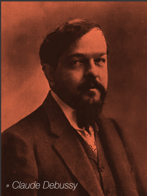
» Claude Debussy

"Noches de Orquesta, volaremos sin movernos"