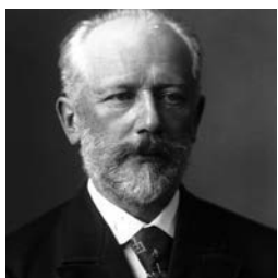
*Pyotr Ilyich Tchaikovsky