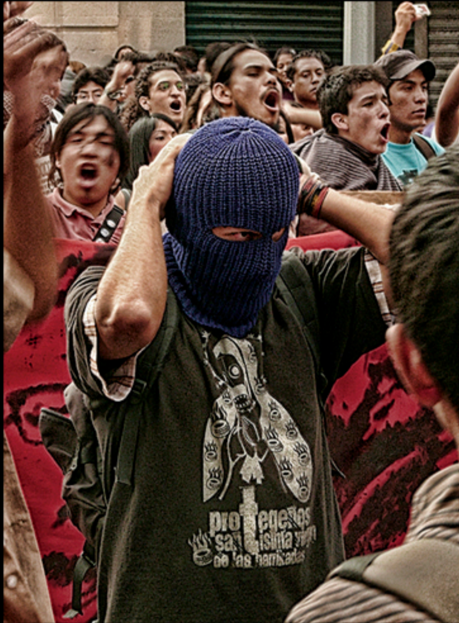
Santísima Virgen de las Barricadas Imagen digital 2013