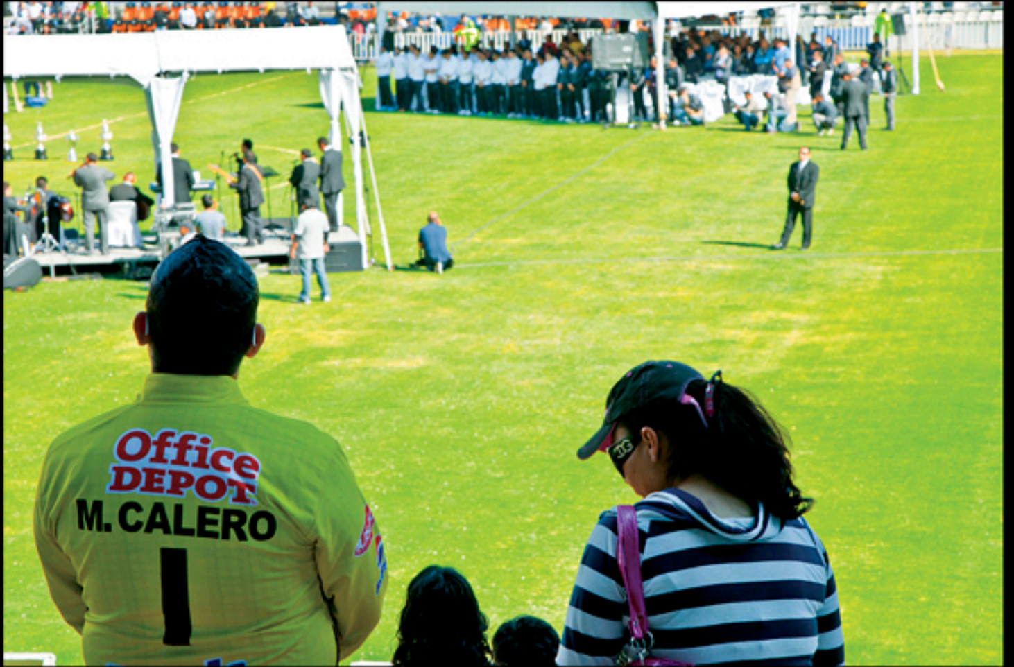
El otro Calero, de la serie: Adiós condor. Imagen digital 2012