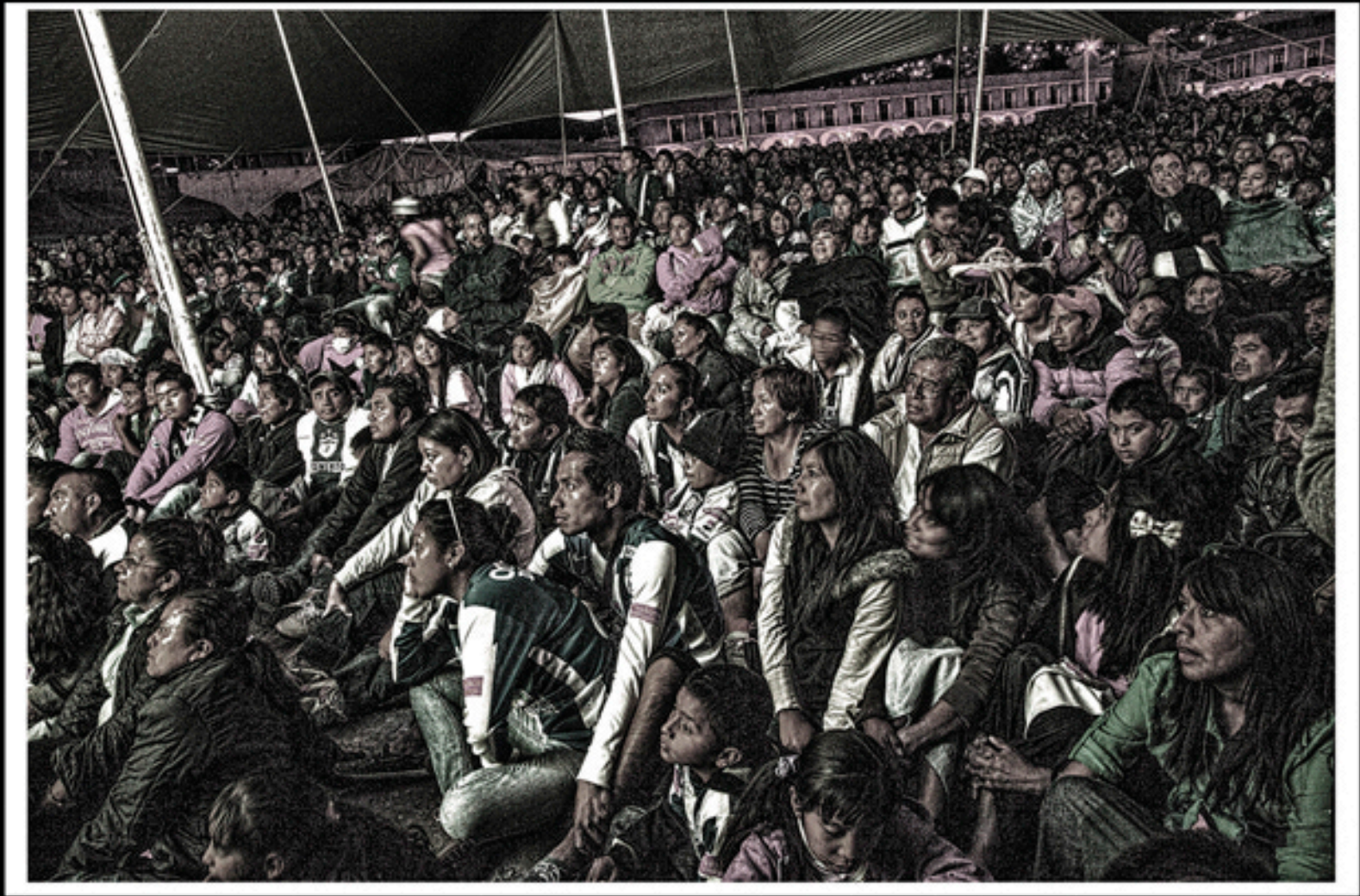
Plaza Juárez, Pachuca-León. Imagen digital 2013