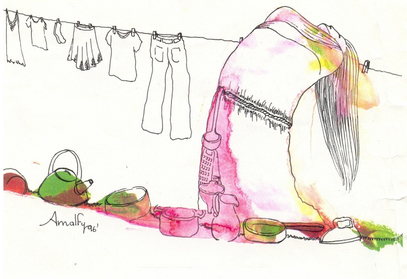
Imagen: Fuenmayor Noriega; Amalfy (2004). Atrapadas en el laberinto cotidiano . Venezuela.

Queda claro entonces, como afirma María-Milagros Rivera que: