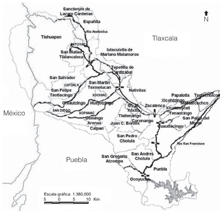
Figura 1. Ubicación de la subcuenca del río Atoyac (modificado de INEGI, 2004). El río Atoyac desde San Jerónimo de Lázaro Cárdenas en Tlaxcala, recorre 31 municipios hacia el sur hasta Puebla, Pue., desembocando en la presa Valsequillo.

como los afluentes y efluentes, se muestran en la Figura 2. Las estaciones son 1) la Exhacienda de Guadalupe, 2) Chiautla de Arenas, 3) Villa Alta, 4) San José Atoyatenco, 5) Puente río Atoyac, 6) San Lorenzo, 7) Puente México, 8) Presa Valsequillo (Sur) y 9) Presa Valsequillo (cortina).