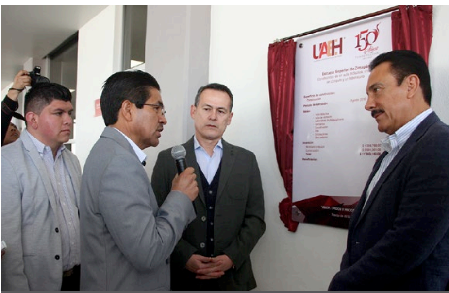
Cientos de alumnos se beneficiarán con nuevas instalaciones en Zimapán