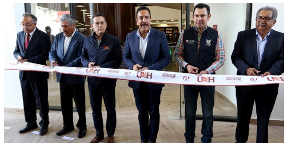
Apertura de la nueva biblioteca de ICSHu