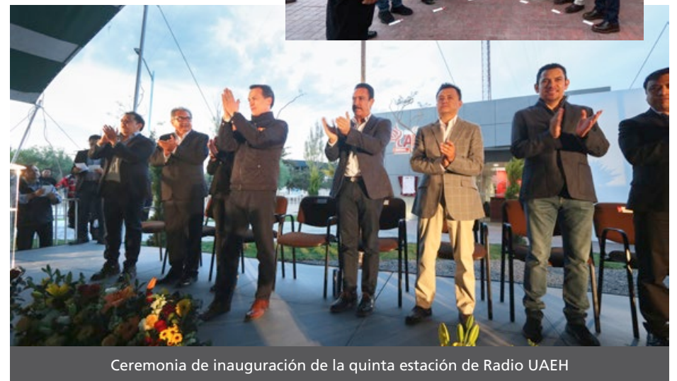
Ceremonia de inauguración de la quinta estación de Radio UAEH