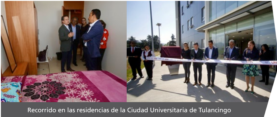
Recorrido en las residencias de la Ciudad Universitaria de Tulancingo