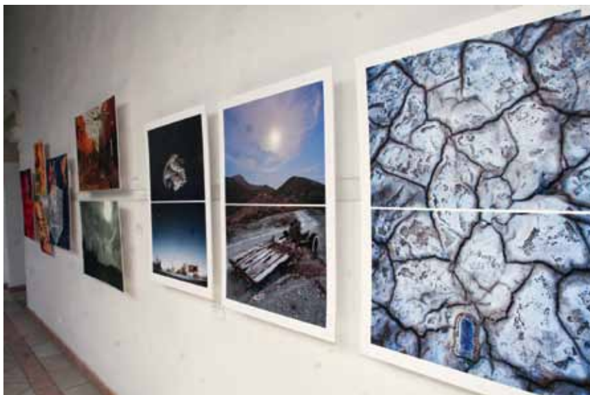
• Pachuca fue la sede de la imagen.