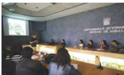
• Taller Naturaleza y fotografía .