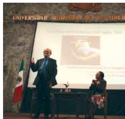
• Los desafíos ambientales en el siglo XXI , José Sarukhán.