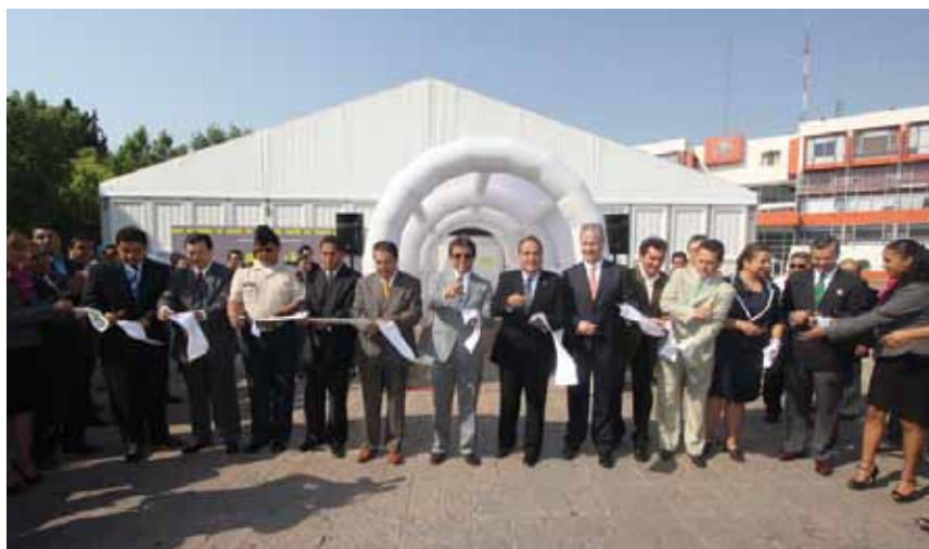
• Acto de inauguración en el Pabellón de Alta Tecnología.