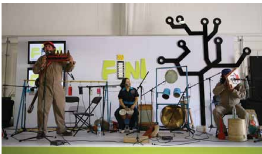
• Espectáculo " Los botes cantan ".