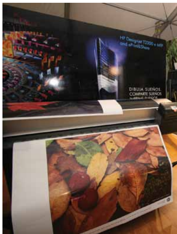
• En el Pabellón de Alta Tecnología se expusieron fotográficos, avances científicos en servicios y relación entre la tecnología y la imagen.