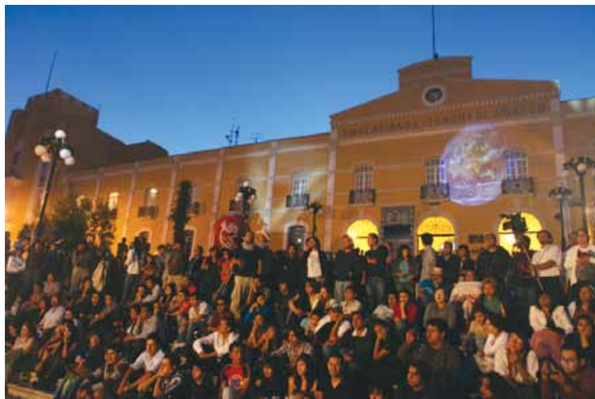
• La comunidad universitaria hidalguense se reunió para la clausura del FINI 2011.