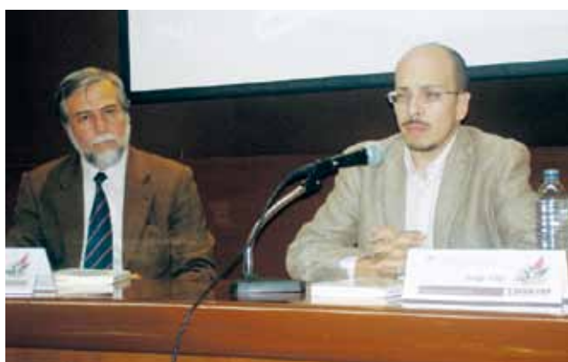
Jorge Volpi presentó su libro El Insomnio de Bolívar , que habla sobre lo que significa la identidad latinoamericana.

Horacio Franco, reconocido flautista, ofreció gran concierto, presentando su disco Mesitajes de la Nueva España