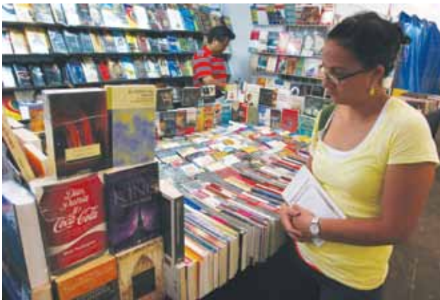
La feria contó con una amplia gama de stands y casas editoriales de las más reconocidas librerías del país.