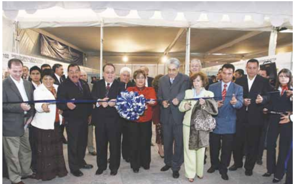
Autoridades de la UAEH, inauguraron la XXIII Feria Universitaria del Libro.

Del 27 de agosto al 3 de septiembre se llevó a cabo la XXIII Feria Universitaria del libro, en la cual se expusieron diversas actividades culturales, musicales, presentaciones de libros y eventos deportivos que adornaron los diversos recintos universitarios y el foro artístico de la Plaza Juárez; La UAEH se vistió de gala con esta Feria la cual tuvo un gran resultado tanto en la comunidad universitaria como en el público en general, logrando así convertirse en una de las celebraciones más importantes para la Universidad y que sin duda fue de gran éxito.