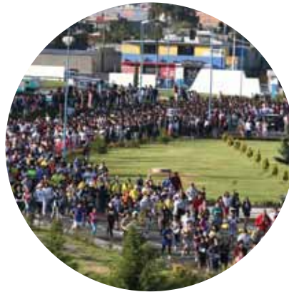
Carrera Atlética Universitaria con más de 4 mil 500 participantes