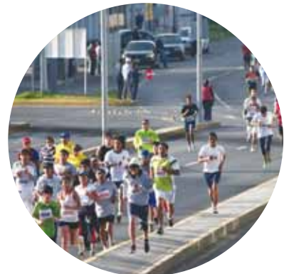
Se recorrieron las principales avenidas de la ciudad de Pachuca