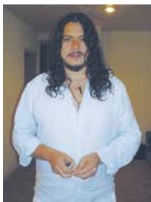
El guitarrista mexicano Paco Rentería ofreció un concierto en la UAEH