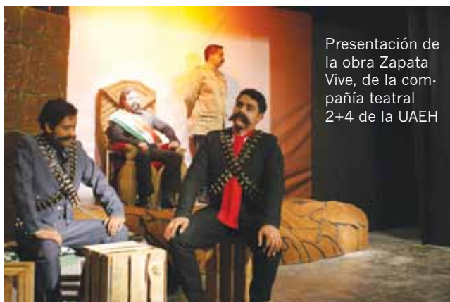
Presentación de la obra Zapata Vive, de la compañía teatral 2+4 de la UAEH

La puesta en escena narró una serie de momentos en la vida de Emiliano Zapata durante la Revolución Mexicana