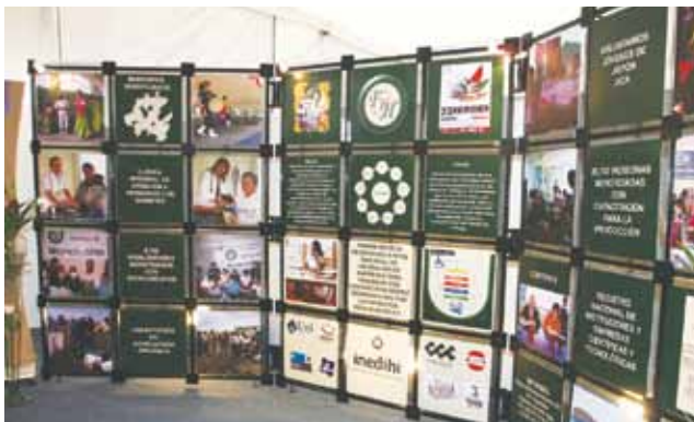
El stand institucional mostró los servicios que oferta la UAEH.