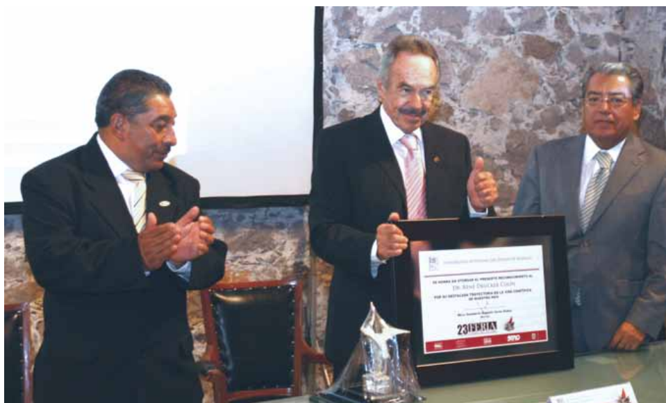
La UAEH rinde homenaje al reconocido científico René Drucker Colín y al pintor José Luis Cuevas