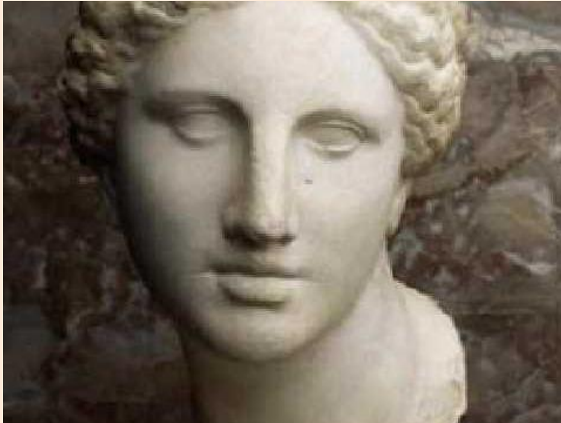
Escultor: Praxíteles, (Hermes)