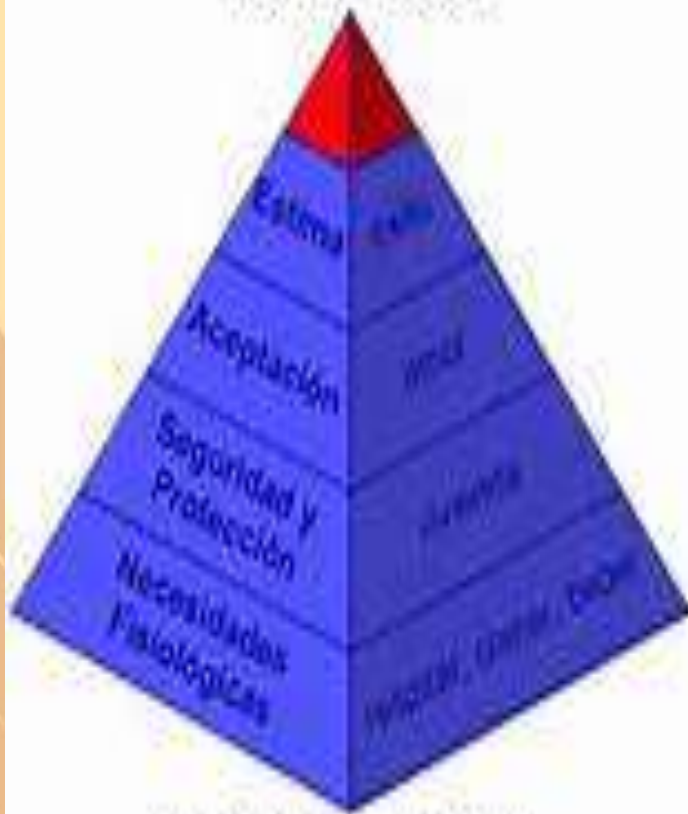
Fig 1. Pirámide de Maslow