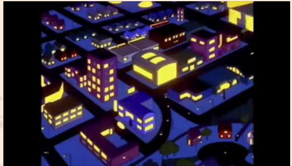
Tomado de: https://gfyat.com/rawmeeitalianbrownbear