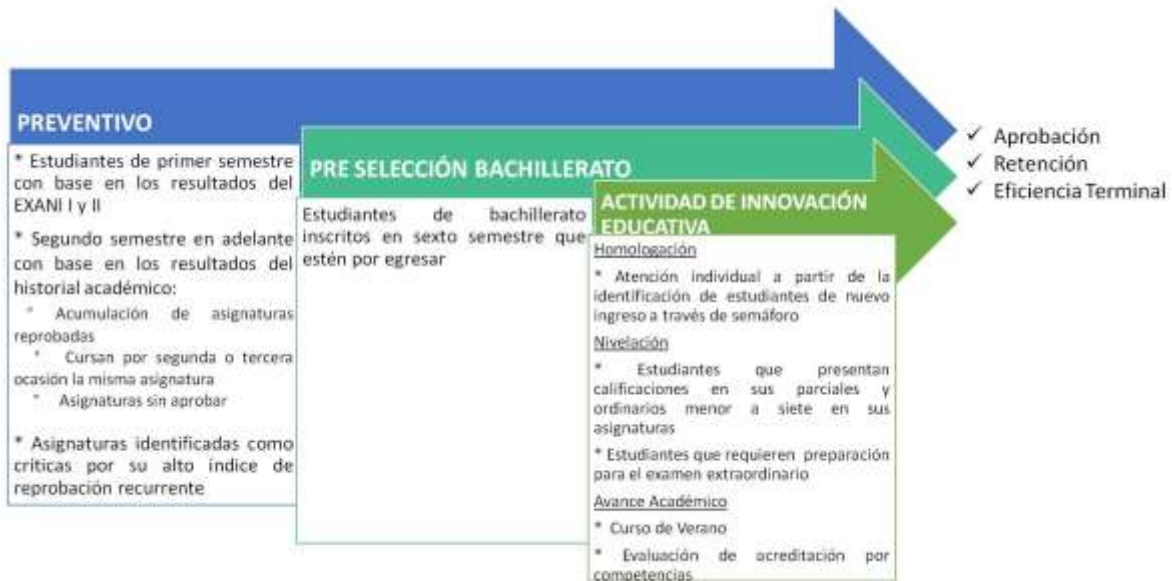
Figura 6: Creación Dirección de Tutorías UAEH