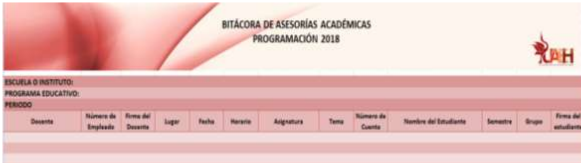
Figura 8: Creación Dirección de Tutorías UAEH