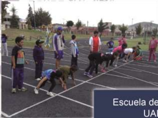
Escuela de Atletismo UAEH

Promueven actividades deportivas y recreativas entre miembros de la comunidad universitaria y sociedad en general, en busca de crear una cultura deportiva.