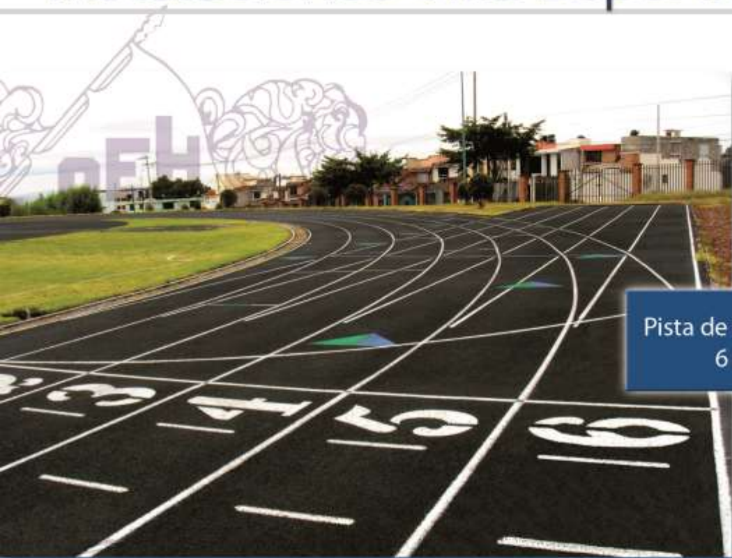
Pista de tartan semi olímpica 6 carriles 400 m