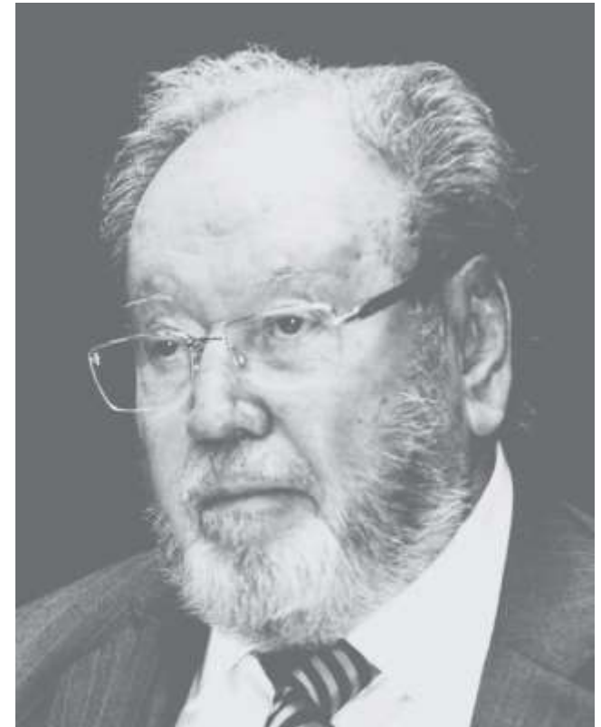
Dr. GUILLERMO SOBERÓN ACEVEDO.

Soberón Acevedo G. El cambio estructural en la salud. IV. El financiamiento de la salud para consolidar el cambio. Salud Pública Mex 1987; 169-177.