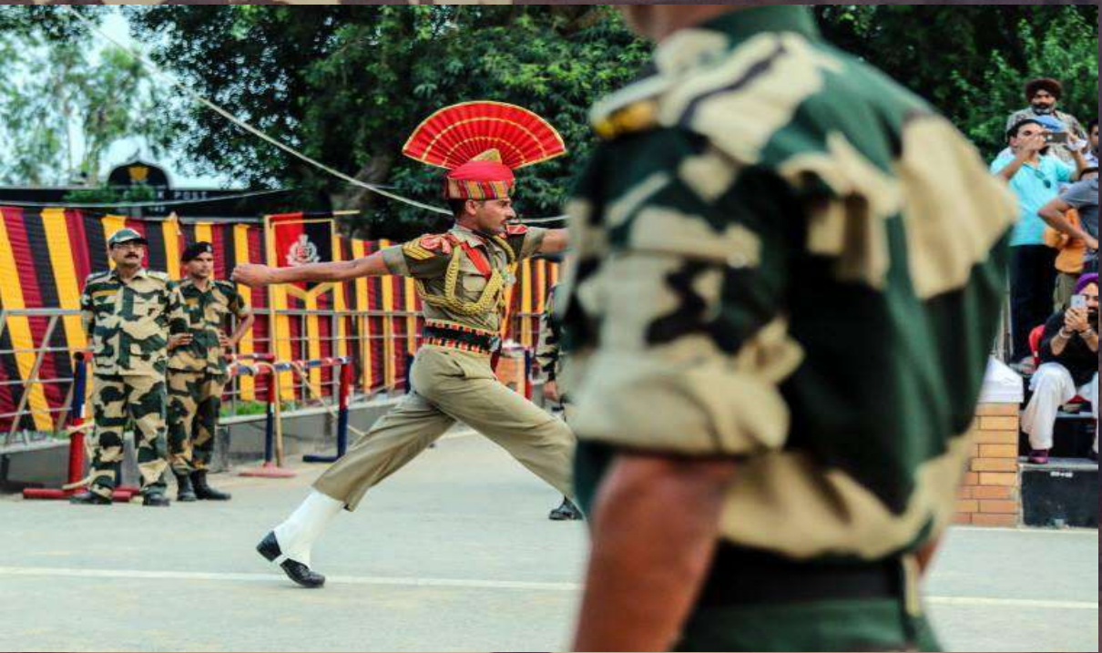
Wagah Border, Amritsar