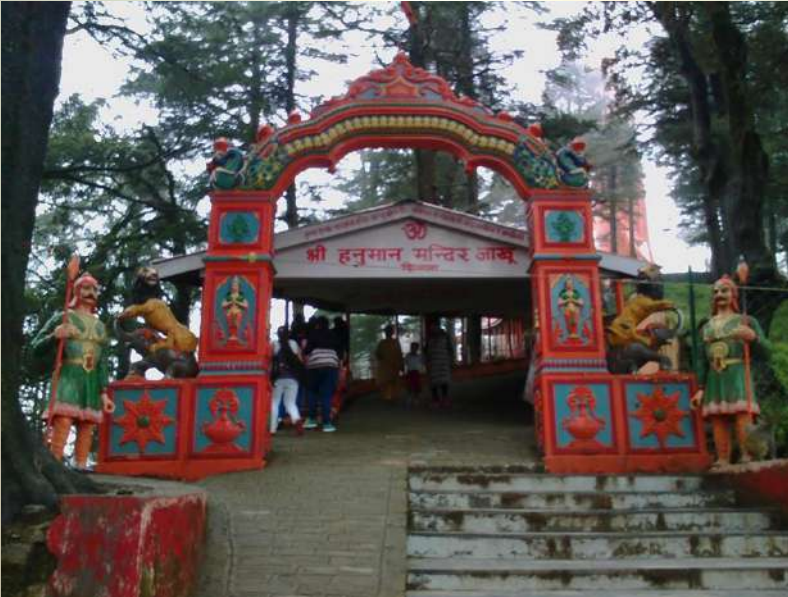
Jakhu Temple, Shimla