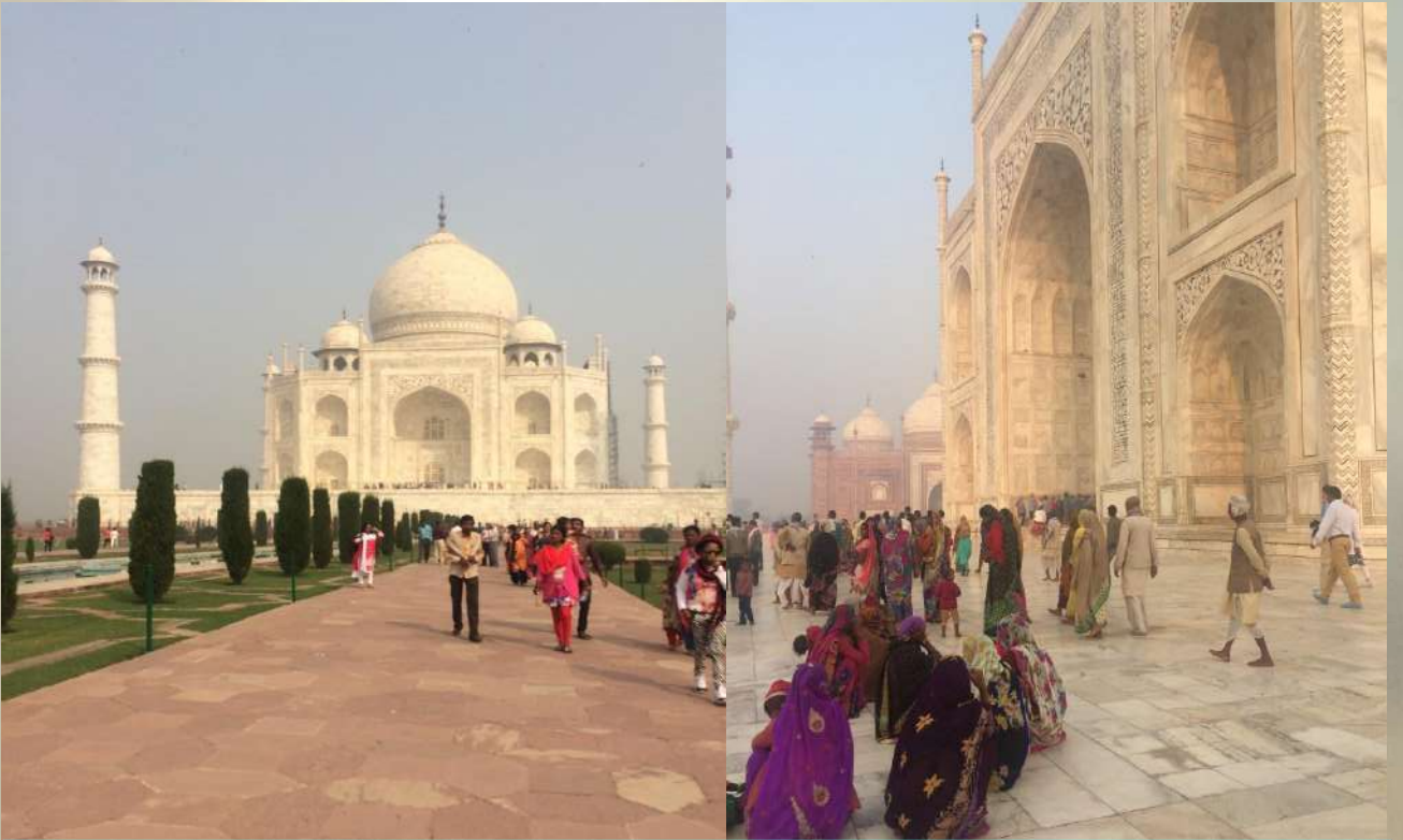
Taj Mahal, Agra