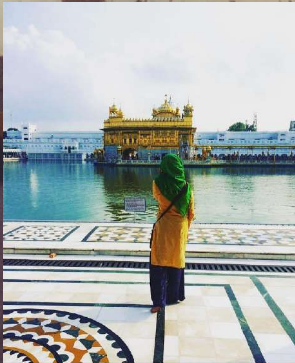
Golden Temple, Amritsar