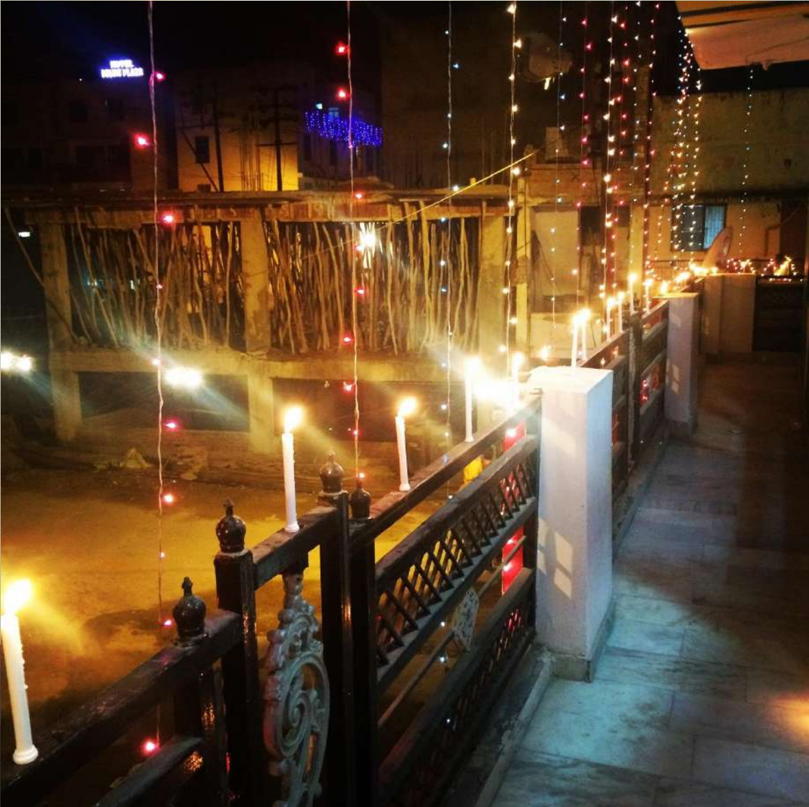
Diwali Festival de las luces