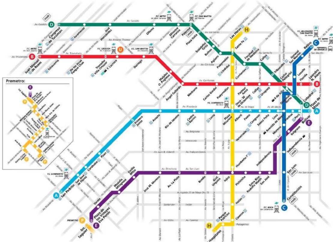
Mapa del Subterráneo