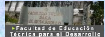
► Facultad de Educación Técnica para el Desarrollo