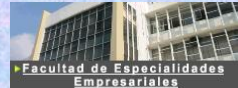
► Facultad de Especialidades Empresariales