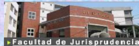
► Facultad de Jurisprudencia