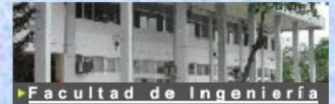
► Facultad de Ingeniería