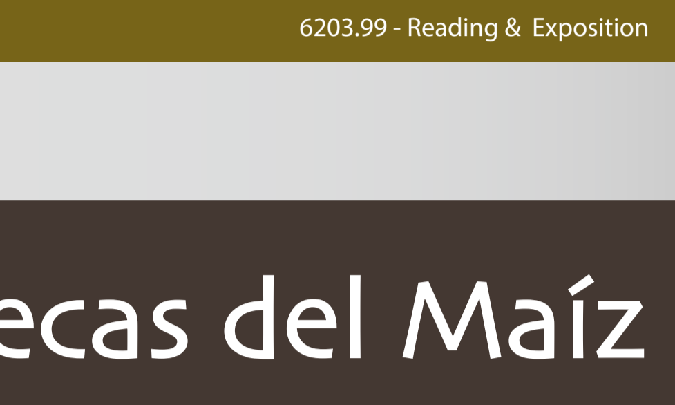
6203.99 - Reading & Exposition