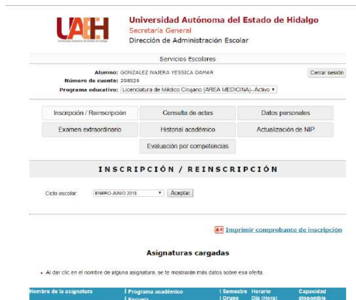
Imagen 2. Dar de alta asignaturas a cursar