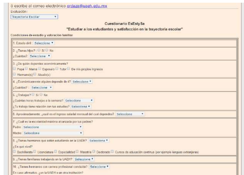
Imagen 4. Cuestionario EsEstySa

A nivel institucional participaron un total de 38,334 estudiantes de nivel bachillerato, licenciatura y posgrado de la UAEH. En el caso de la Escuela Superior de Tlahuelilpan han participado 1,641 estudiantes de los siguientes programas educativos: