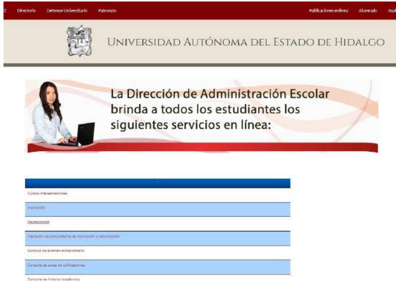
Imagen 1. Acceso para el procedimiento de reinscripción