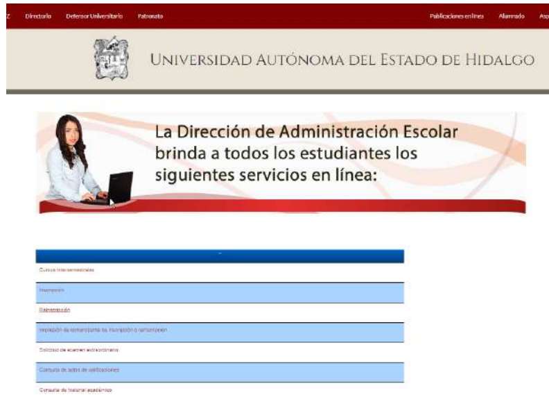
Imagen 1. Acceso para el procedimiento de reinscripción