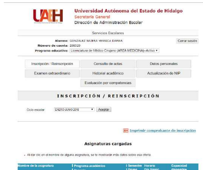
Imagen 2. Dar de alta asignaturas a cursar