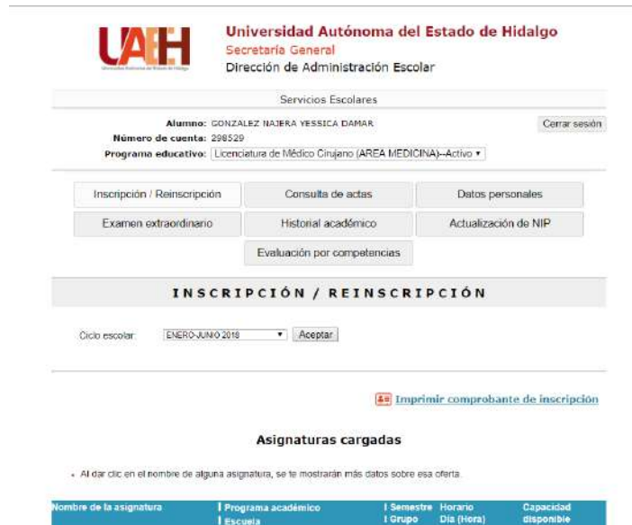
Imagen 2. Dar de alta asignaturas a cursar