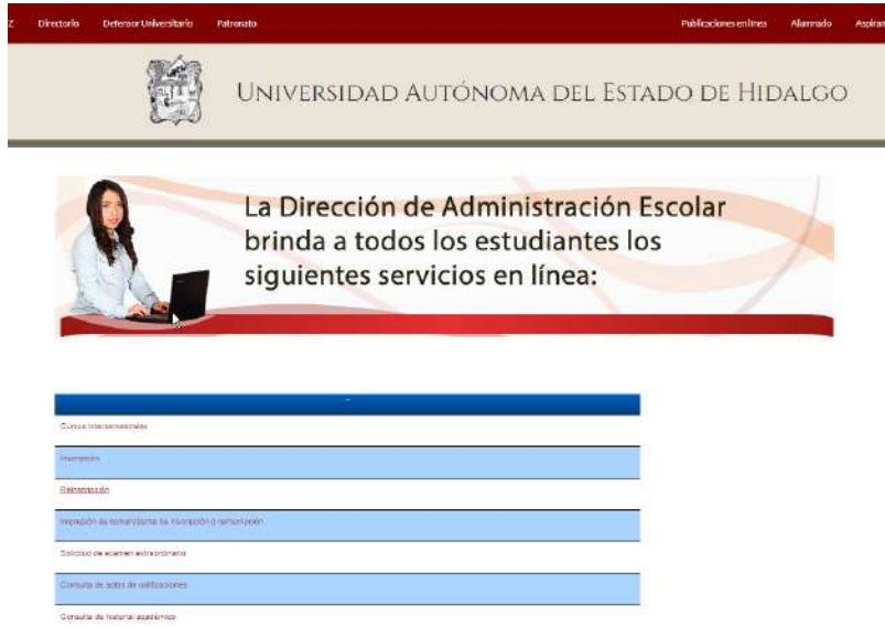
Imagen 1. Acceso para el procedimiento de reinscripción