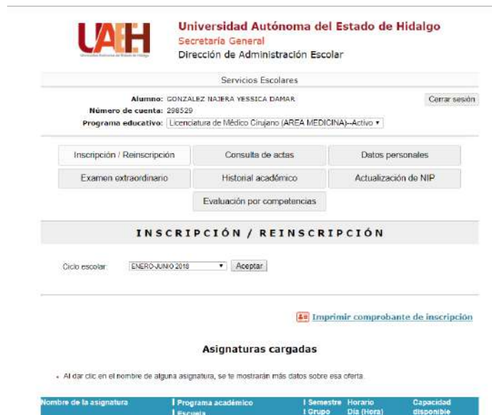
Imagen 2. Dar de alta asignaturas a cursar