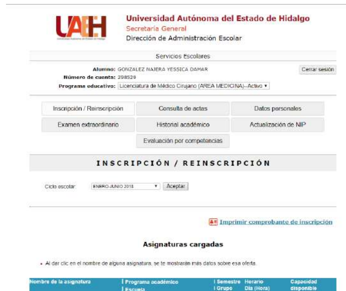
Imagen 2. Dar de alta asignaturas a cursar