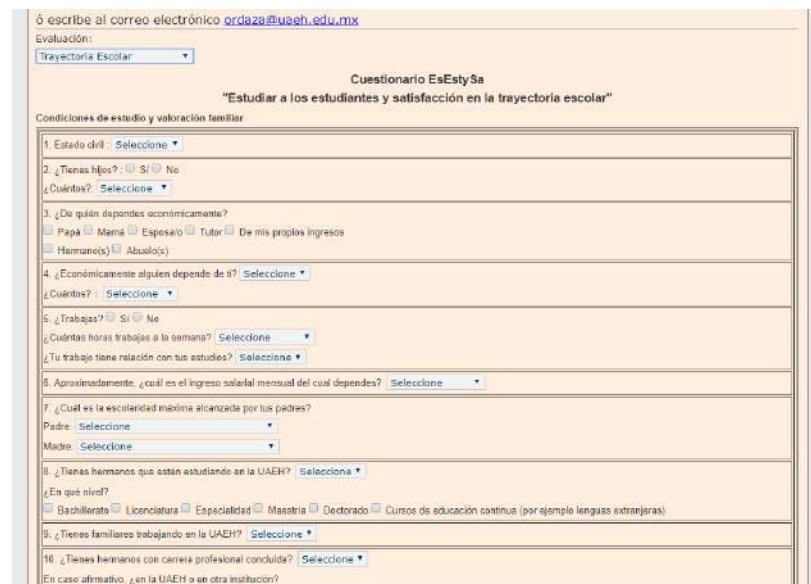
Imagen 4. Cuestionario EsEstySa

A nivel institucional participaron un total de 38,334 estudiantes de nivel bachillerato, licenciatura y posgrado de la UAEH. En el caso del Instituto de Ciencias Sociales y Humanidades 2,591 estudiantes de los siguientes programas educativos: