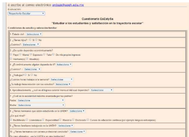
Imagen 4. Cuestionario EsEstySa

A nivel institucional participaron un total de 38,334 estudiantes de nivel bachillerato, licenciatura y posgrado de la UAEH. En el caso del Instituto de Ciencias Económico Administrativas 4,013 estudiantes de los siguientes programas educativos: