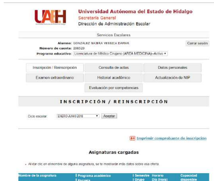
Imagen 2. Dar de alta asignaturas a cursar