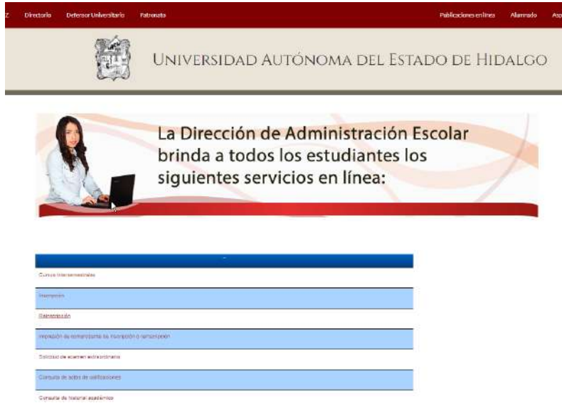
Imagen 1. Acceso para el procedimiento de reinscripción