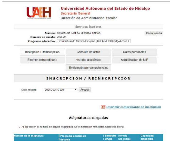
Imagen 2. Dar de alta asignaturas a cursar