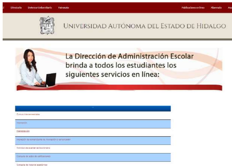
Imagen 1. Acceso para el procedimiento de reinscripción

y nip; posterior a realizar el procedimiento para su reinscripción el sistema por medio de un link direcciona a una ventana en la que se muestra el cuestionario que debe contestar de acuerdo al nivel educativo.