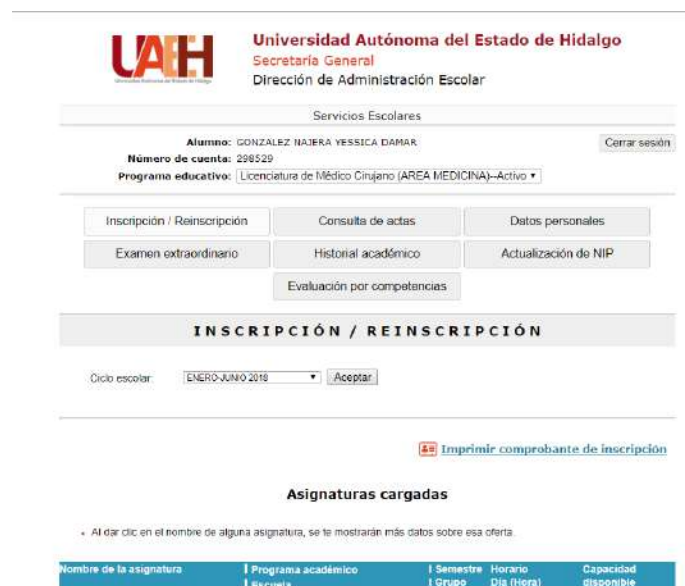
Imagen 2. Dar de alta asignaturas a cursar