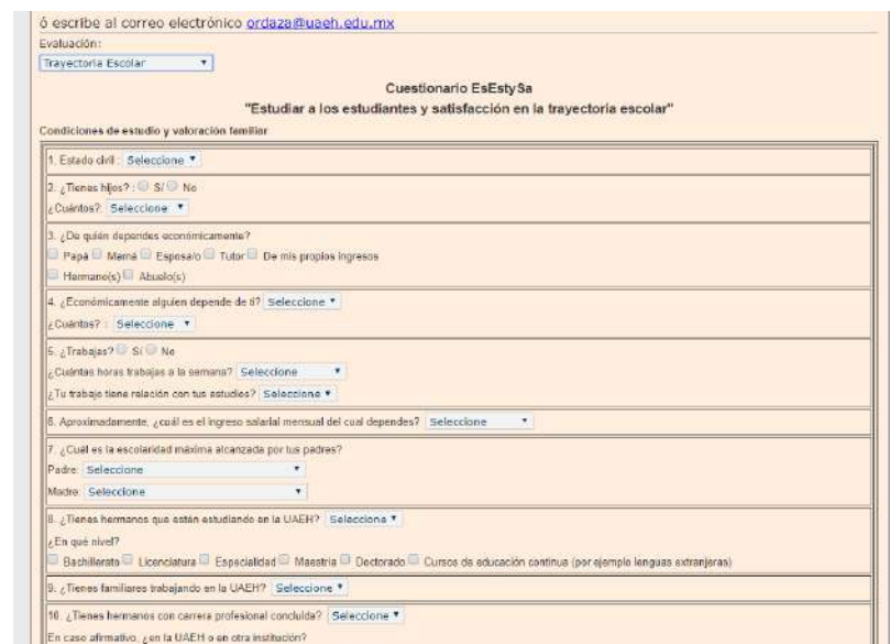
Imagen 4. Cuestionario EsEstySa

A nivel institucional participaron un total de 38,334 estudiantes de nivel bachillerato, licenciatura y posgrado de la UAH. En el caso de la Escuela Superior de Apan 241 estudiantes de los siguientes programas educativos: