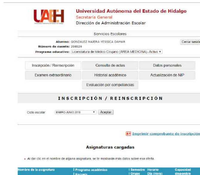
Imagen 2. Dar de alta asignaturas a cursar