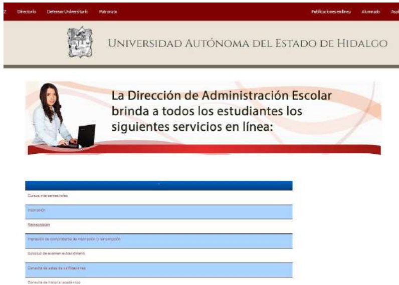
Imagen 1. Acceso para el procedimiento de reinscripción