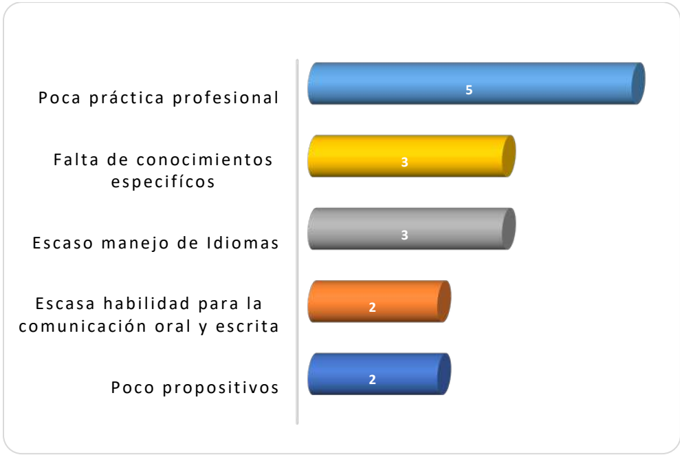
Gráfica 2.3 Principales debilidades de los egresados al momento de la contratación