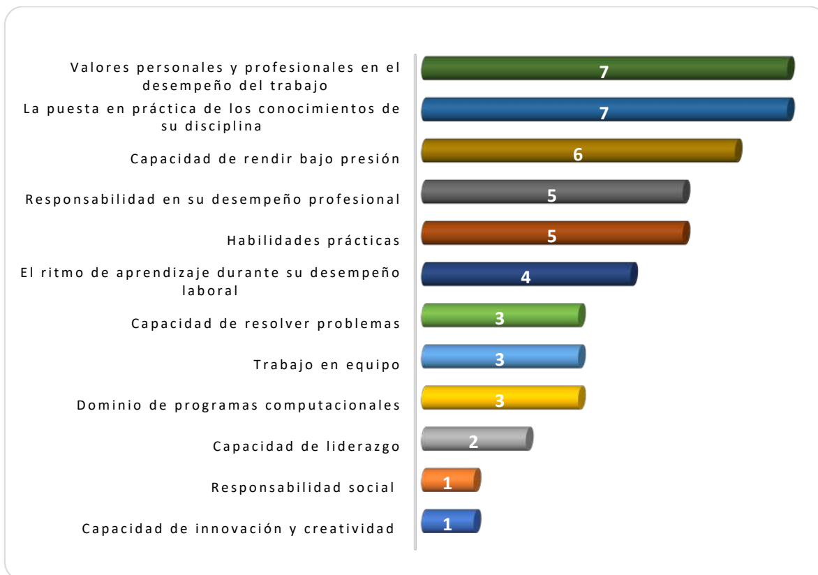
Gráfica 3.1 Aspectos más importantes que poseen los egresados de esta licenciatura, considerados por los empleadores

empleadores. Otras capacidades mencionadas fueron: el ritmo de aprendizaje durante su desempeño laboral, la capacidad de resolver problemas, el trabajo en equipo, el dominio de programas computacionales, la capacidad de liderazgo, la responsabilidad social y la capacidad de innovación y creatividad como se muestra en la Gráfica 3.1.