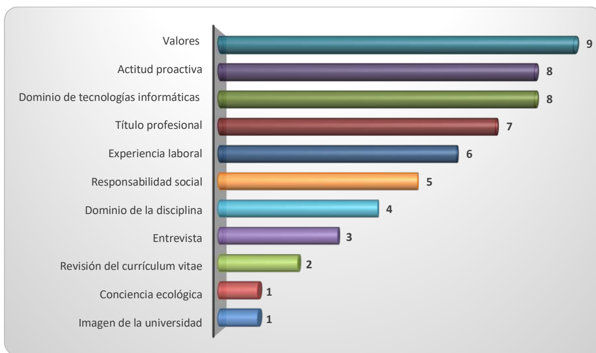
Gráfica 2.2 Requisitos más importantes para determinar la contratación

Los requisitos que determinan la contratación de los egresados se muestran en la Gráfica 2.2. Observándose que 9 empresas consideran principalmente los valores identificados en los egresados, 8 empresas consideran la actitud proactiva y el dominio de tecnologías informáticas respectivamente. 7 empresas señalaron la importancia de contar con el título profesional. Otros requisitos señalados fueron: la experiencia laboral, la responsabilidad social, el dominio de la disciplina, el resultado de la entrevista, la revisión del currículum vitae, una conciencia ecológica y la imagen de la institución.