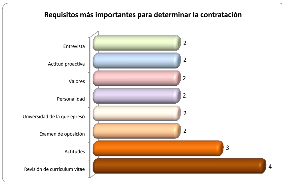
Gráfica 2.2 Requisitos más importantes para determinar la contratación

Otros requisitos importantes que requieren para determinar la contratación de los egresados se muestran en la gráfica 2.2, la revisión del currículum vitae es el aspecto más representativo en la opinión de los cuatro empleadores.