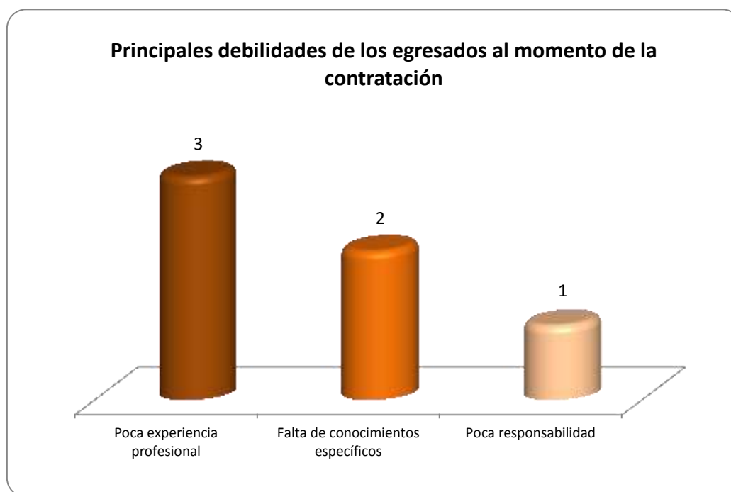
Gráfica 2.3 Principales debilidades de los egresados al momento de la contratación

En la gráfica 2.3 se observa que las debilidades consideradas como las más importantes son: la poca experiencia profesional, esto considerado por 3 empleadores encuestados; en segundo lugar está la falta de conocimientos específicos, esto en la opinión de 2 empleadores y en tercer lugar está la poca responsabilidad, esto considerado por un empleador.