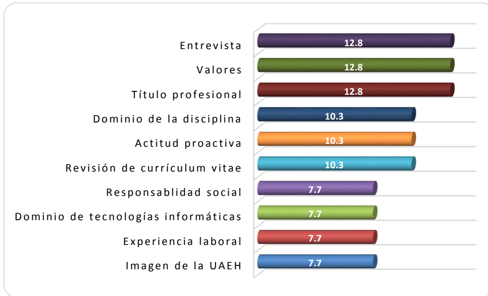
Gráfica 2.2 Requisitos más importantes para determinar la contratación