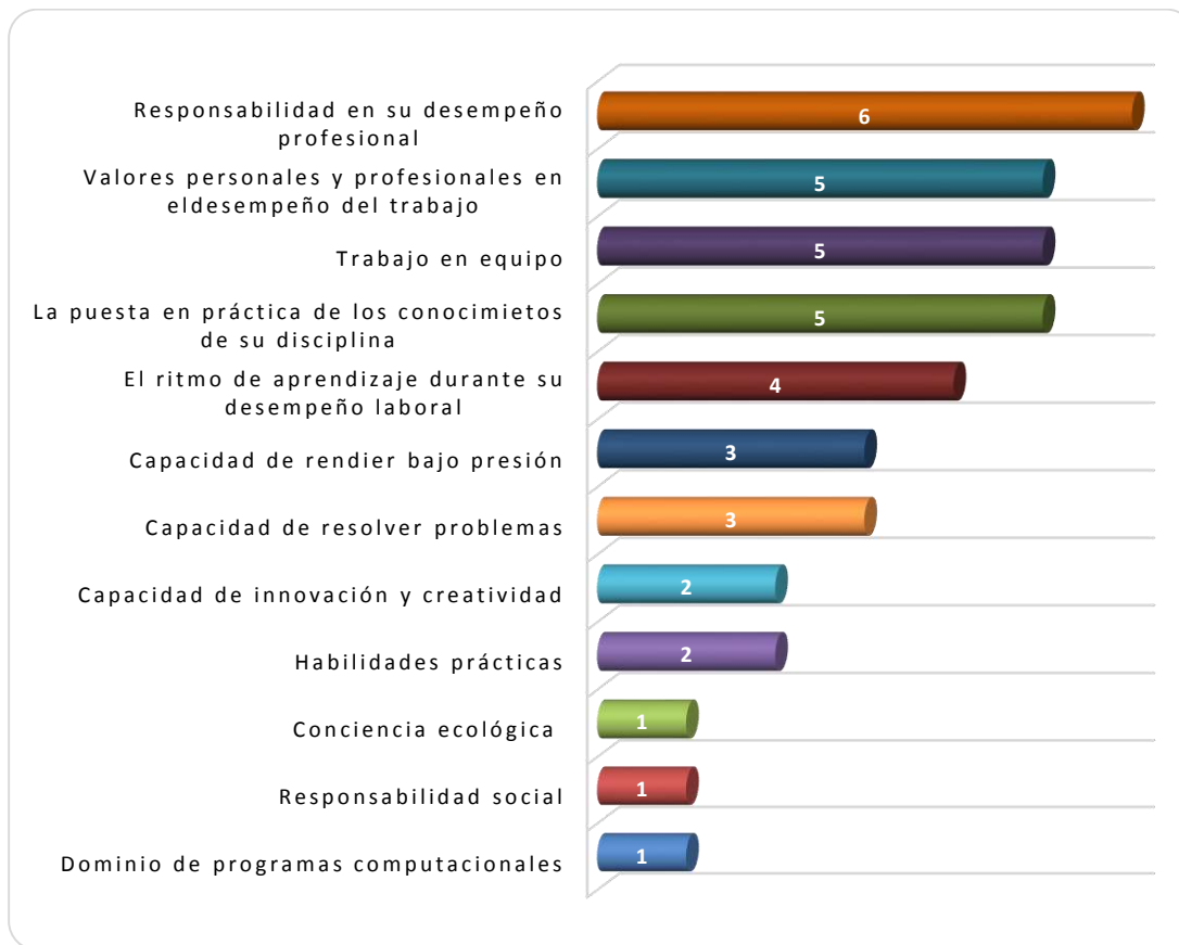
Gráfica 3.1 Aspectos más importantes que poseen los egresados de esta licenciatura, considerados por los empleadores

otros aspectos señalados por los empleadores de los egresados del programa educativo de Administración.