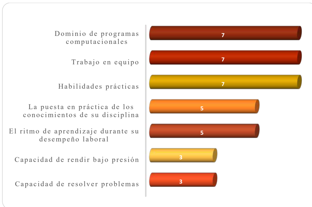
Gráfica 3.1 Aspectos más importantes que poseen los egresados de esta licenciatura, considerados por los empleadores

empresas mencionaron la puesta en práctica de los conocimientos de su disciplina y el ritmo de aprendizaje durante su desempeño laboral, mientras que 3 empresas destacaron la capacidad de rendir bajo presión y la capacidad de resolver problemas como se muestra en la Gráfica 3.1.