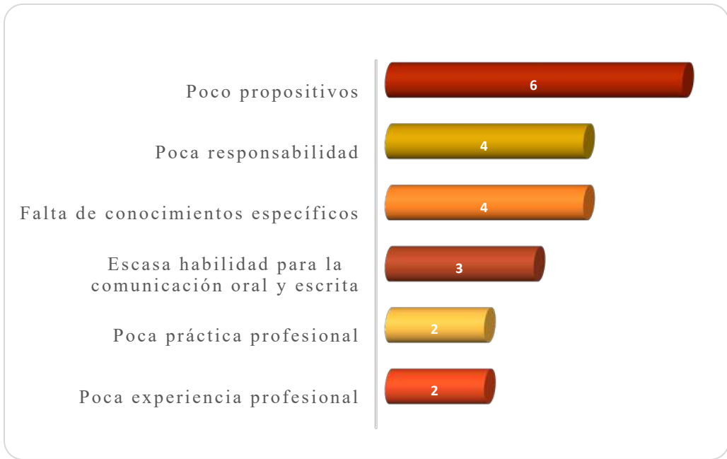
Gráfica 2.3 Principales debilidades de los egresados al momento de la contratación