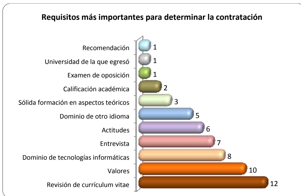
Gráfica 2.2 Requisitos más importantes para determinar la contratación

Otros requisitos importantes que requieren para determinar la contratación de los egresados se muestran en la Gráfica 2.2.