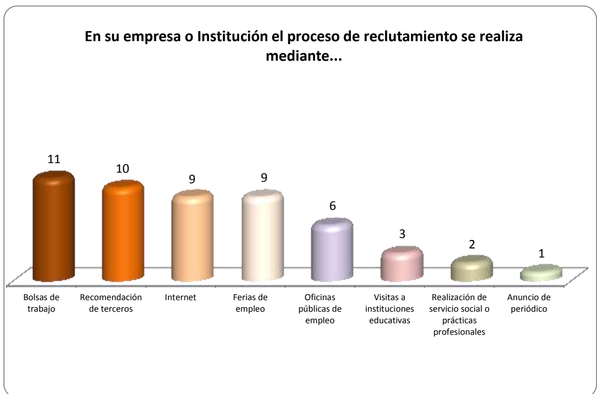
Gráfica 2.1 Medios de reclutamiento más utilizados por los empleadores y sus frecuencias de uso

A continuación en la Gráfica 2.1 tenemos 8 opciones que se utilizan como indicadores para observar los medios más frecuentes de reclutamiento, donde el medio más utilizado son las bolsas de trabajo, esto en la opinión de 11 empleadores.