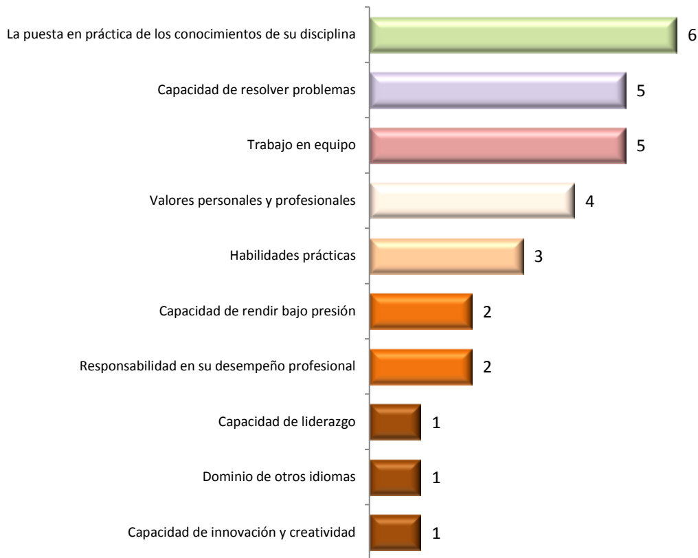
Gráfica 3.1 Aspectos que poseen los egresados de esta licenciatura, considerados por los empleadores como los más importantes