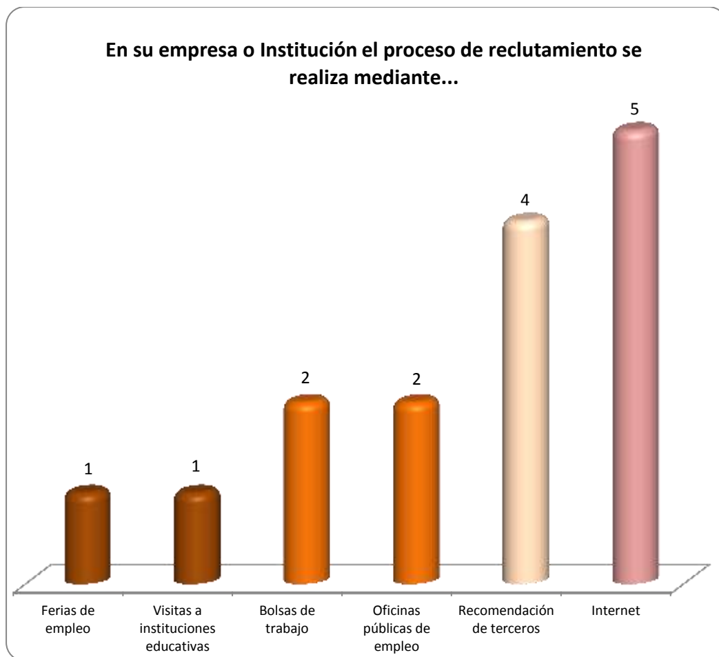
Gráfica 2.1 Medios de reclutamiento más utilizados por los empleadores y sus frecuencias de uso

A continuación en la Gráfica 2.1 tenemos 6 opciones que se utilizan como indicadores para observar los medios más frecuentes de reclutamiento. Se observa que el internet es el medio de reclutamiento que más empleadores utilizan, esto para los 5 casos; asimismo la recomendación de terceros es utilizada como proceso de reclutamiento, para 4 empleadores, esto como lo más representativo.