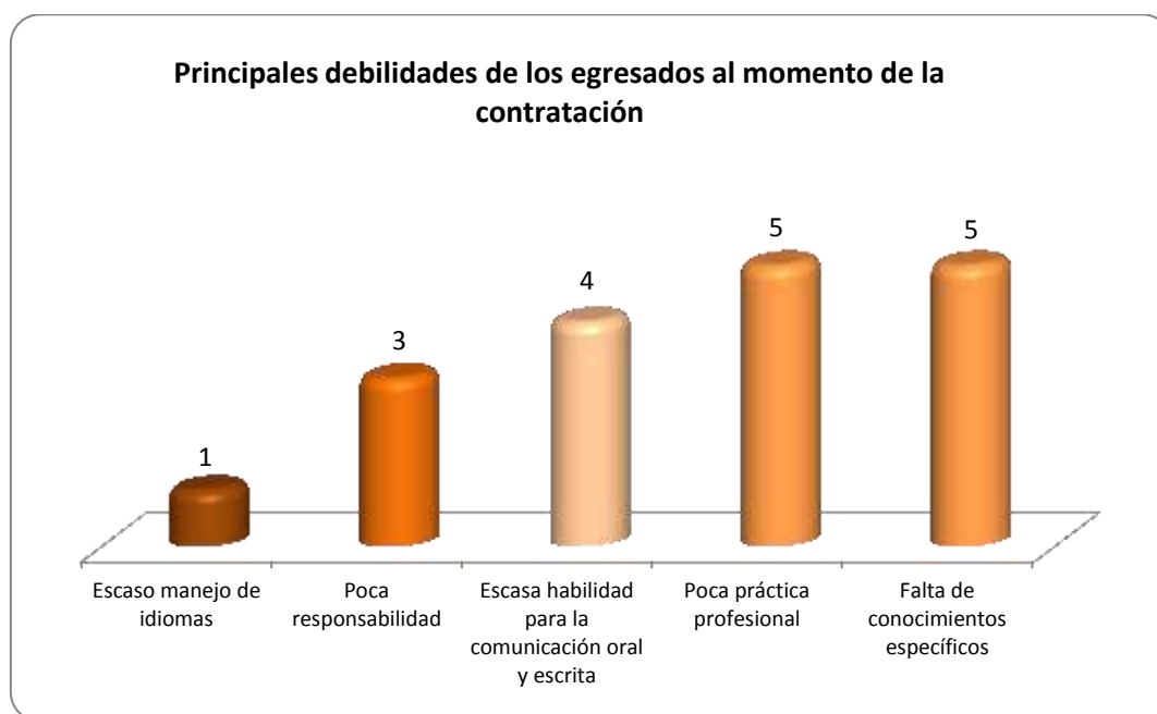
Gráfica 2.3 Principales debilidades de los egresados al momento de la contratación

En la Gráfica 2.3 se observa que las debilidades consideradas como las más importantes son: la falta de conocimientos específicos y la poca práctica profesional, esto en la opinión de 5 empleadores respectivamente; la escasa habilidad para la comunicación oral y escrita, esto considerado por 4 empleadores, entre lo más representativo.