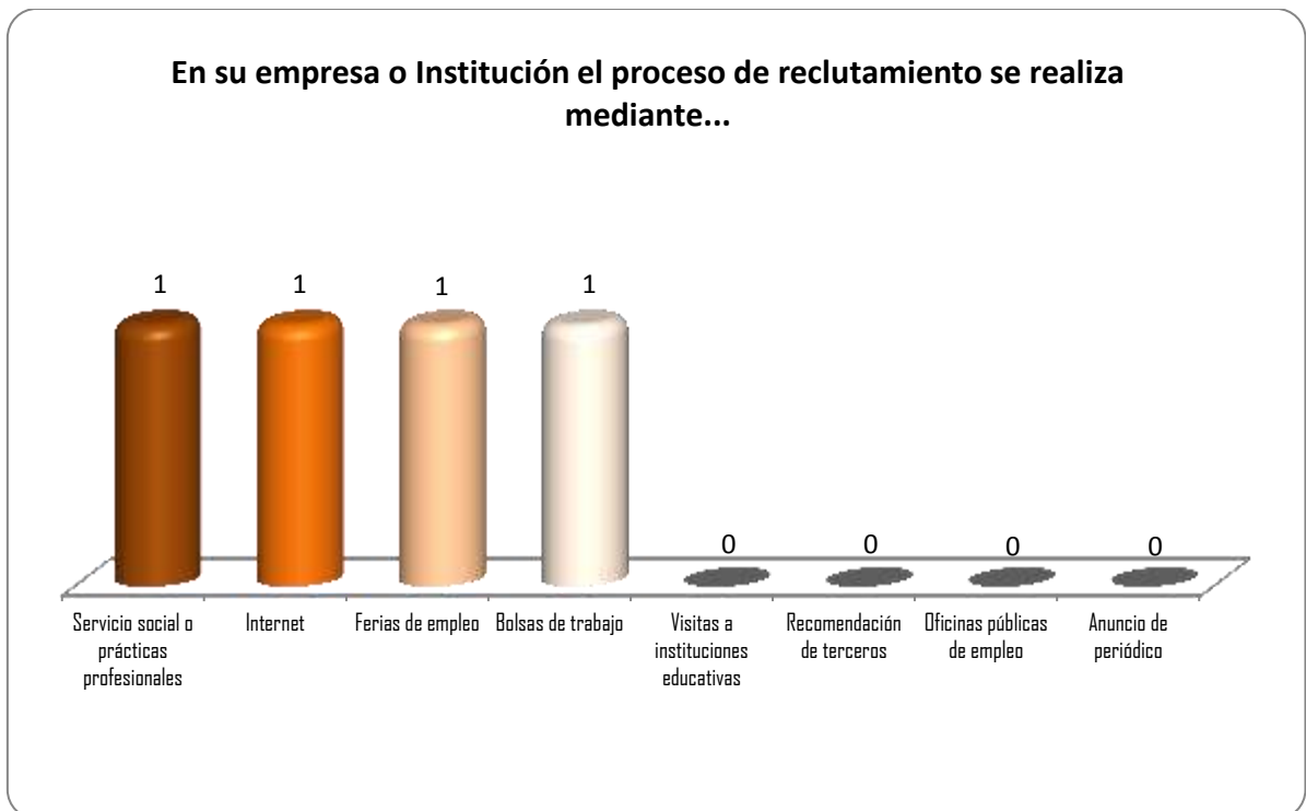
Gráfica 2.1 Medios de reclutamiento más utilizados por los empleadores y sus frecuencias de uso

A continuación en la Gráfica 2.1 tenemos 4 opciones que se utilizan como indicadores para observar los medios más frecuentes de reclutamiento, donde el medio más utilizado es el servicio social o prácticas profesionales, internet, ferias de empleo y bolsas de trabajo, esto en la opinión de un empleador respectivamente.