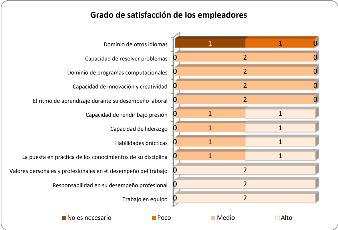
Gráfica 3.1 Frecuencias y grado de satisfacción asignados por los empleadores

Se observa que en la mayoría de los aspectos, para los empleadores, el grado de satisfacción que tienen con respecto a los egresados de la UAEH se encuentra en una escala alta.