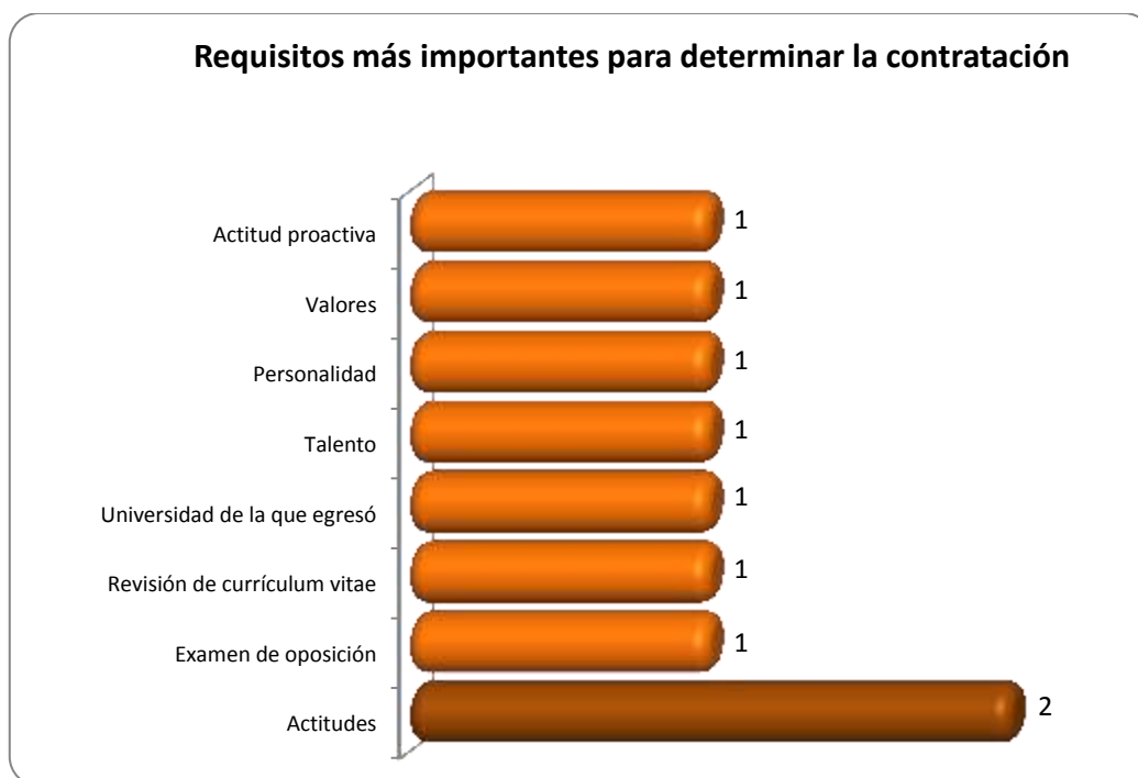
Gráfica 2.2 Requisitos más importantes para determinar la contratación

Otros requisitos importantes que requieren para determinar la contratación de los egresados se muestran en la Gráfica 2.2.