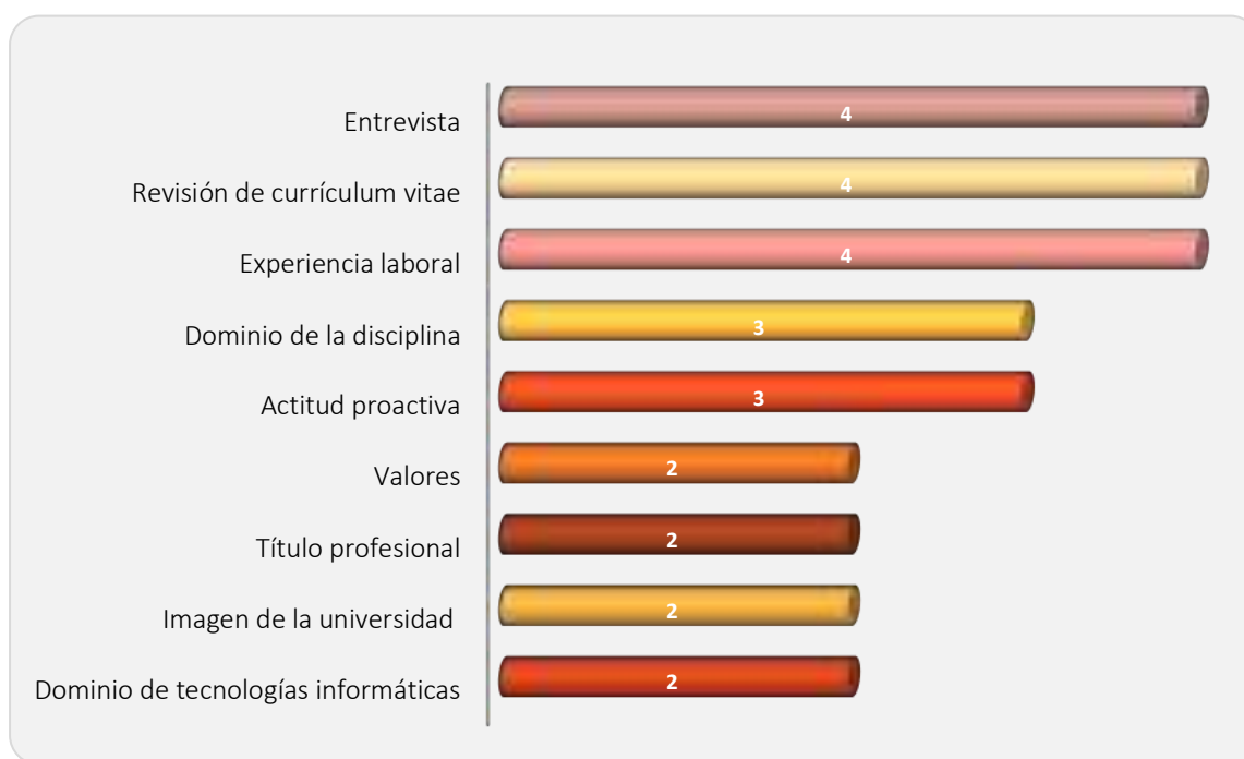
Gráfica 2.2 Requisitos más importantes para determinar la contratación

Los requisitos que determinan la contratación de los egresados se muestran en la Gráfica 2.2 observándose que 4 empleadores consideran principalmente el resultado de la entrevista, la revisión del currículum vitae y la experiencia laboral. El dominio de la disciplina y la actitud proactiva mencionado por 3 empleadores respectivamente. Otros requisitos citados fueron: Los valores mostrados por los empleadores, la obtención del título profesional, la imagen de la universidad y el dominio de las tecnologías informáticas.