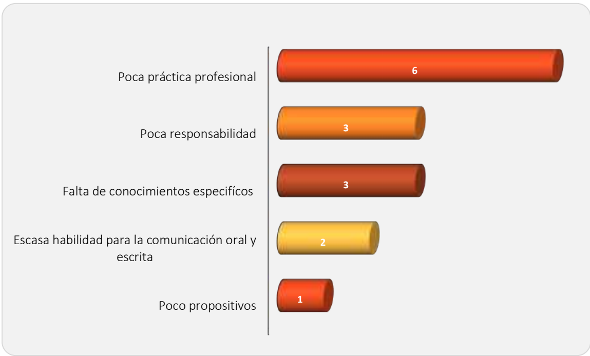
Gráfica 2.3 Principales debilidades de los egresados al momento de la contratación