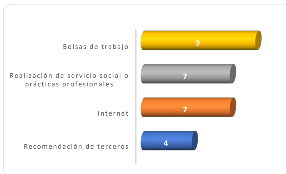
Gráfica 2.1 Medios de reclutamiento más utilizados por los empleadores

La Gráfica 2.1 muestra los medios de reclutamiento para el proceso de contratación observándose que el mayormente utilizado por los empleadores y/o personal de recursos humanos es a través de la bolsa de trabajo, lo anterior debido a que 9 de las 14 empresas así lo manifestaron. La realización del servicio social y/o prácticas profesionales, así como el uso del internet son otros medios utilizados por 7 de los empleadores que contestaron la encuesta. Finalmente 4 empleadores seleccionaron la recomendación de terceros.