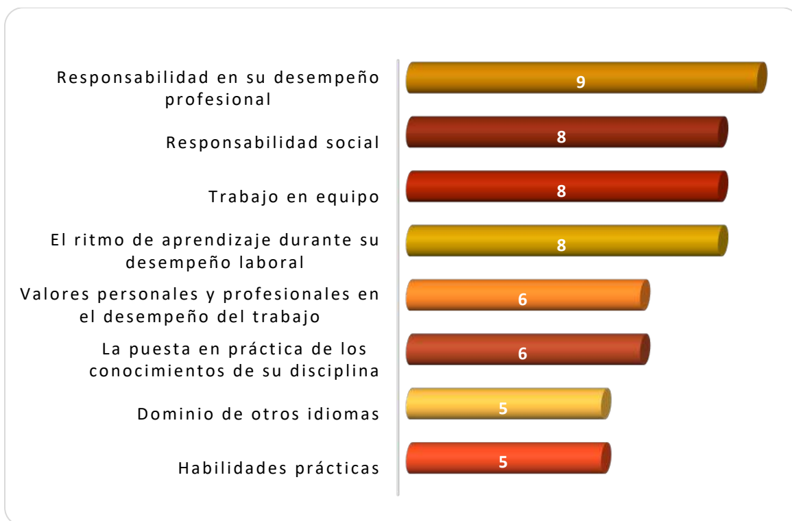
Gráfica 3.1 Aspectos más importantes que poseen los egresados de esta licenciatura, considerados por los empleadores

indicado por 9 empresas, la responsabilidad social, el trabajo en equipo y el ritmo de aprendizaje durante su desempeño laboral señalado por 8 empresas respectivamente. Otras capacidades mencionadas fueron: los valores personales y profesionales en el desempeño del trabajo y la puesta en práctica de los conocimientos de su disciplina manifestado por 6 empresas. Finalmente 5 empleadores coincidieron en el dominio de otros idiomas y las habilidades prácticas como se muestra en la Gráfica 3.1.