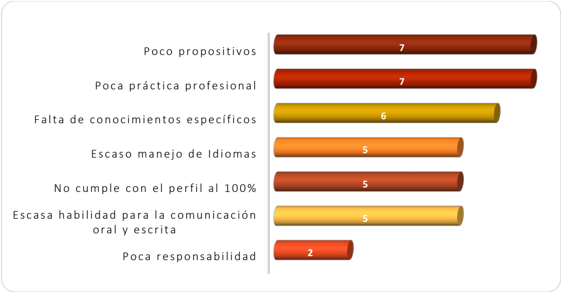
Gráfica 2.3 Principales debilidades de los egresados al momento de la contratación

habilidad para la comunicación oral y escrita respectivamente. Otra debilidad mencionada por dos empleadores fue la poca responsabilidad ver Gráfica 2.3.