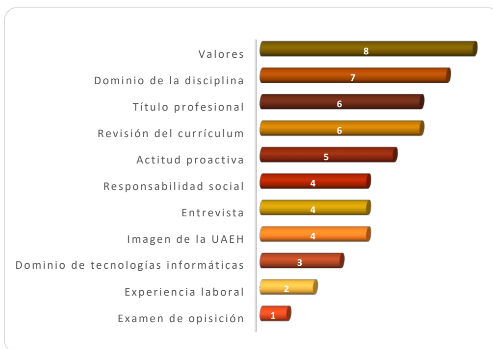
Gráfica 2.2 Requisitos más importantes para determinar la contratación

Los requisitos que determinan la contratación de los egresados se muestran en la Gráfica 2.2. Observándose que 8 empresas consideran principalmente los valores, 7 empleadores mencionaron el dominio de la disciplina en tanto que 6 empresas coincidieron que lo más importante para ellos es la obtención del título profesional y la revisión del currículum respectivamente. Otros requisitos seleccionados fueron: la actitud proactiva, la responsabilidad social, el resultado de la entrevista y la imagen de la universidad, el dominio de tecnologías informáticas, la experiencia laboral y el resultado del examen de oposición.