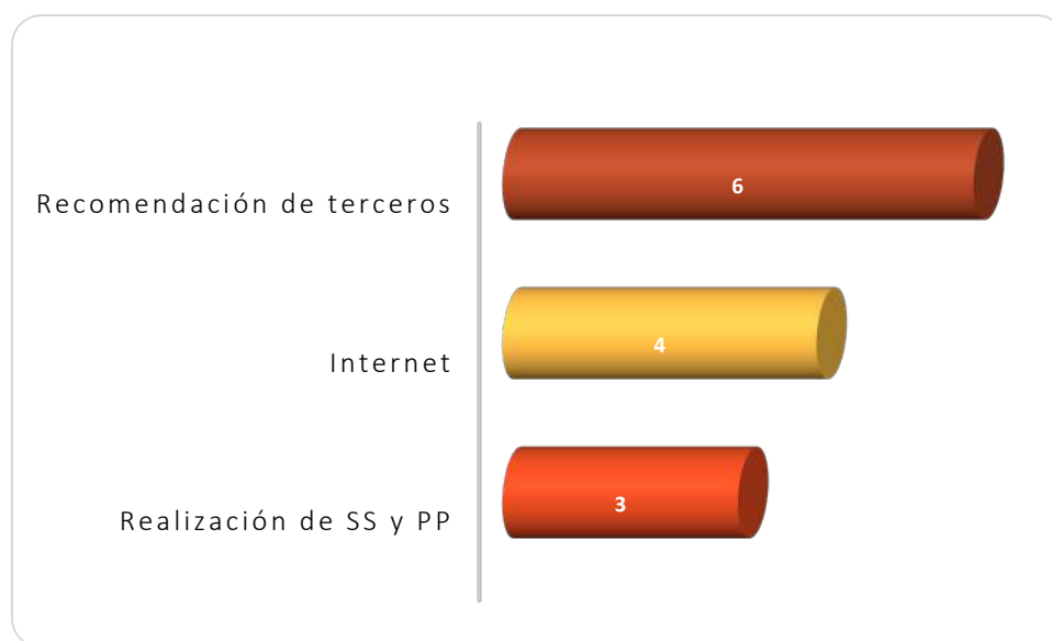
Gráfica 2.1 Medios de reclutamiento más utilizados por los empleadores

La Gráfica 2.1 muestra los medios de reclutamiento para el proceso de contratación observándose que el mayormente utilizado por los empleadores y/o personal de recursos humanos es a través de la recomendación de terceros, lo anterior debido a que 6 de las 10 empresas así lo manifestaron. Otro medio utilizado por los empleadores es a través del Internet, manifestado por 4 empresas. Finalmente 3 empresas coincidieron que el proceso de contratación lo realizan mediante el servicio social y las prácticas profesionales.