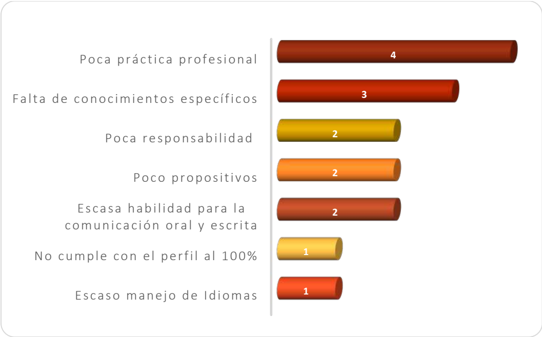
Gráfica 2.3 Principales debilidades de los egresados al momento de la contratación

manifestadas fueron: no cumplir con el perfil al 100% y escaso manejo de idiomas, ver Gráfica 2.3.