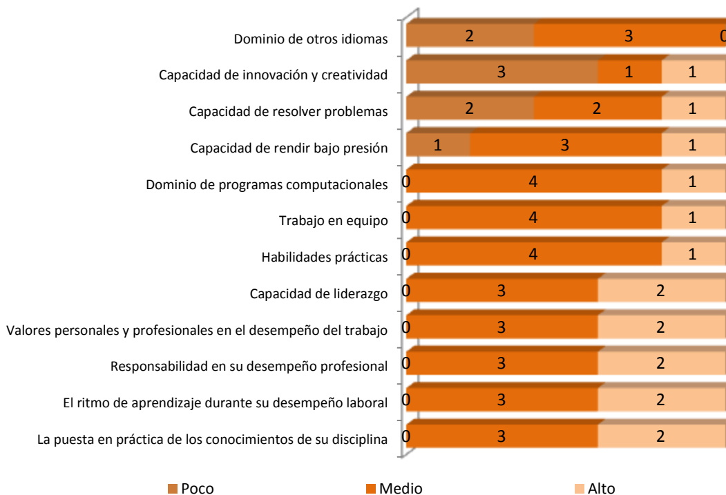
Gráfica 3.1 Frecuencias y grado de satisfacción asignados por los empleadores