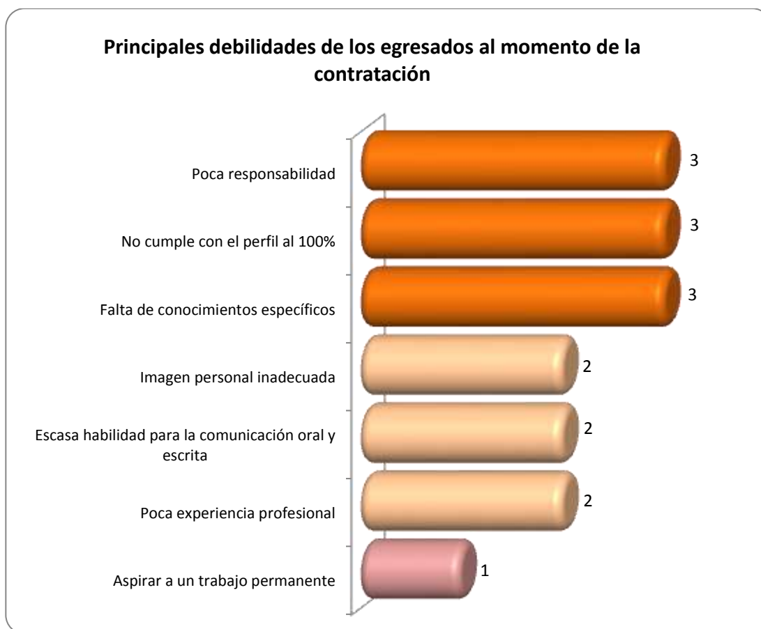
Gráfica 2.3 Principales debilidades de los egresados al momento de la contratación

En la gráfica 2.3 se observa que las debilidades consideradas como las más importantes son: poca responsabilidad, no cumple con el perfil al 100% y falta de conocimientos específicos, esto considerado por 3 empleadores respectivamente.