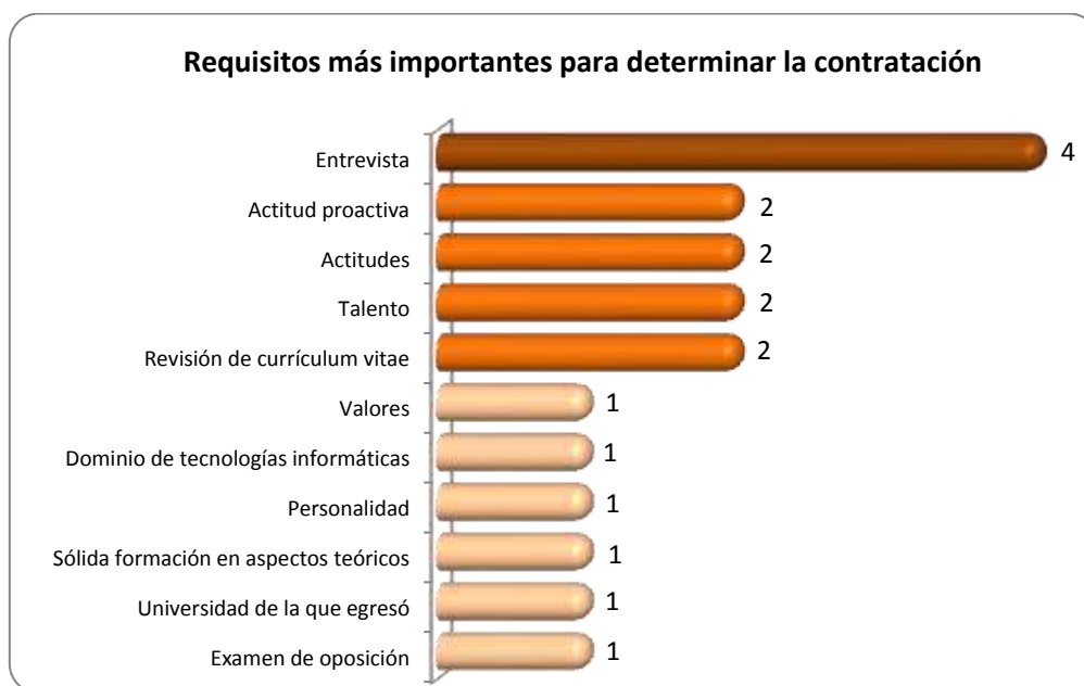
Gráfica 2.2 Requisitos más importantes para determinar la contratación

Otros requisitos importantes que requieren para determinar la contratación de los egresados se muestran en la gráfica 2.2, la entrevista es el aspecto más representativo en 4 casos.