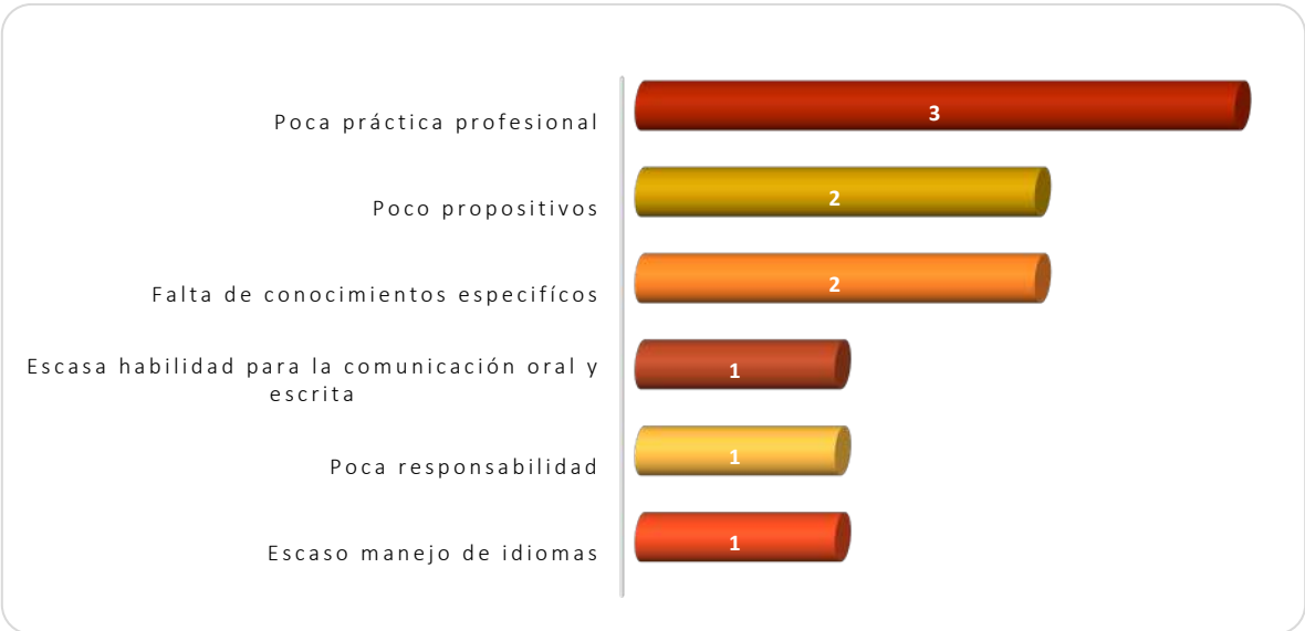
Gráfica 2.3 Principales debilidades de los egresados al momento de la contratación