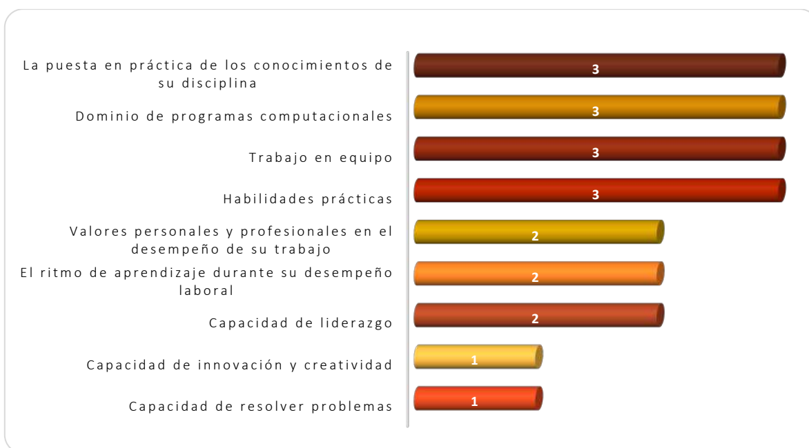
Gráfica 3.1 Aspectos más importantes que poseen los egresados de esta licenciatura, considerados por los empleadores

En la Gráfica 3.1 se observan las capacidades mencionadas por los empleadores que son fundamentales para la contratación de los egresados de este Programa Educativo, destacando las siguientes: la puesta en práctica de los conocimientos de su disciplina, dominio de programas computacionales, trabajo en equipo y las habilidades prácticas citadas por 3 empleadores respectivamente. Otras capacidades consideradas fueron: los valores personales y profesionales en el desempeño de su trabajo, el ritmo de aprendizaje durante el desempeño laboral, la capacidad de liderazgo, la capacidad de innovación y creatividad y la capacidad de resolver problemas, como se muestra en la Gráfica 3.1.