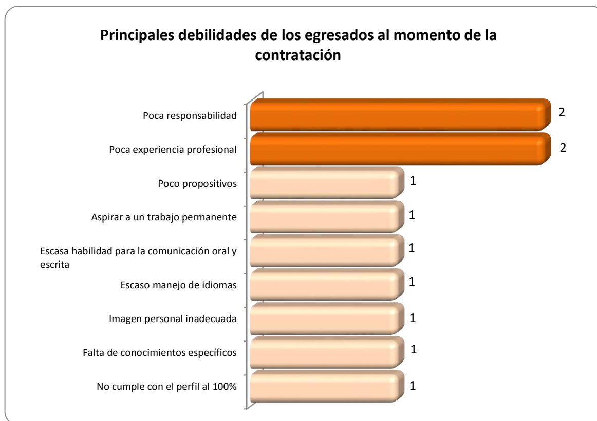
Gráfica 2.3 Principales debilidades de los egresados al momento de la contratación

En la Gráfica 2.3 se observa que las debilidades consideradas como las más importantes son: poca responsabilidad y poca experiencia profesional, esto considerado por 2 empleadores.