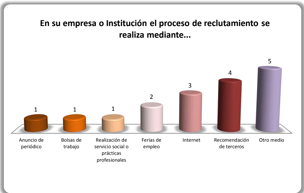
Gráfica 2.1 Medios de reclutamiento más utilizados por los empleadores y sus frecuencias de uso

A continuación en la Gráfica 2.1 tenemos 7 opciones que se utilizan como indicadores para observar los medios más frecuentes de reclutamiento. Se observa que el internet y la recomendación de terceros son los medios que se usan principalmente para ingresar a una empresa, lo cual se identificó con 3 y 4 empleadores respectivamente; por otro lado, para 5 empleadores se utiliza otro medio de reclutamiento.