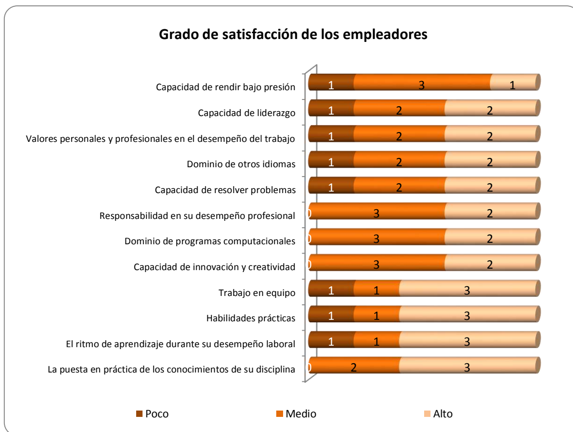
Gráfica 3.1 Frecuencias y grado de satisfacción asignados por los empleadores

Debido a lo anterior, se observa que en la mayoría de los aspectos mencionados, para los empleadores el grado de satisfacción que tienen con respecto a los egresados de la UAEH se encuentra en una escala alta.