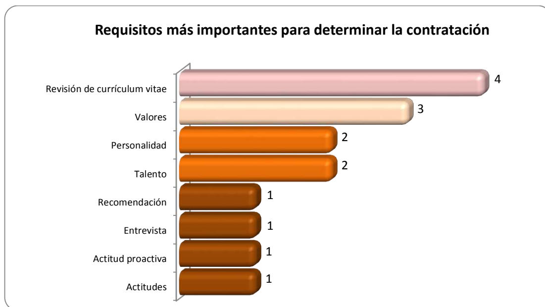
Gráfica 2.2 Requisitos más importantes para determinar la contratación

Otros requisitos importantes que requieren para determinar la contratación de los egresados se muestran en la Gráfica 2.2, la Revisión de currículum vitae es el aspecto más representativo en 4 casos.