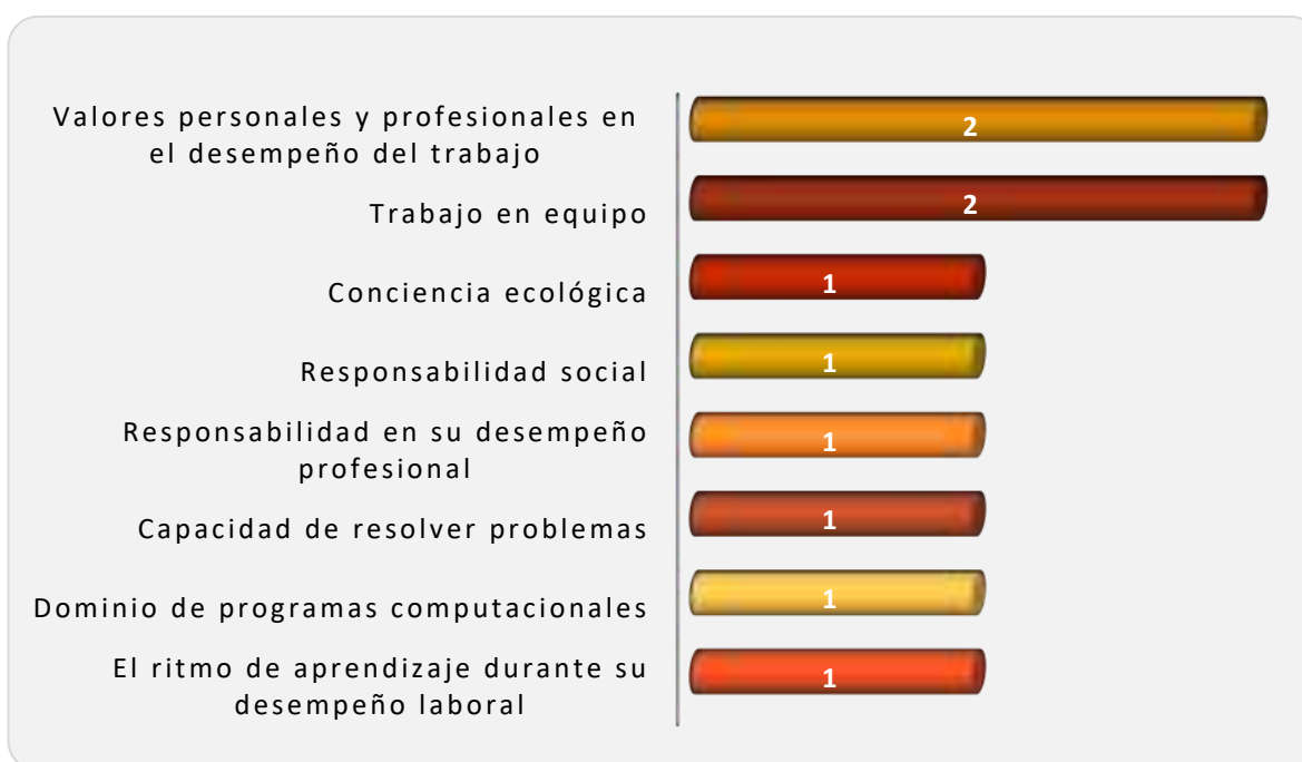
Gráfica 3.1 Aspectos más importantes que poseen los egresados de esta licenciatura, considerados por los empleadores

En la Gráfica 3.1 se observan las capacidades mencionadas por los empleadores que son fundamentales para la contratación de los egresados del programa educativo en Física y Tecnología Avanzada, destacando las siguientes: Valores personales y profesionales en el desempeño del trabajo y el trabajo en equipo indicado por los dos empleadores. Otras capacidades citadas fueron: La conciencia ecológica, la responsabilidad social, la responsabilidad en su desempeño profesional, la capacidad de resolver problemas, el dominio de programas computacionales y el ritmo de aprendizaje durante su desempeño laboral, ver Gráfica 3.1.