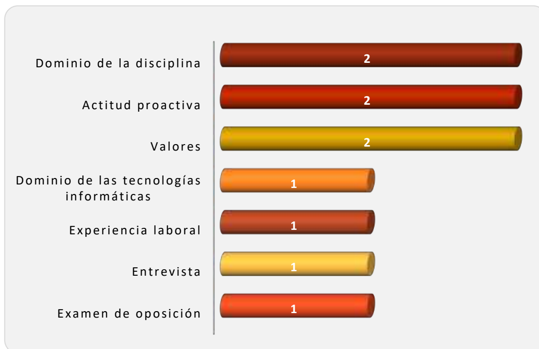
Gráfica 2.2 Requisitos más importantes para determinar la contratación

Los requisitos que determinan la contratación de los egresados se muestran en la Gráfica 2.2. Observándose que los 2 empleadores consideran principalmente el dominio de la disciplina, la actitud proactiva y los valores mostrados por los egresados. Otros requisitos citados fueron; el dominio de las tecnologías informáticas, la experiencia laboral, el resultado de la entrevista y del examen de oposición.