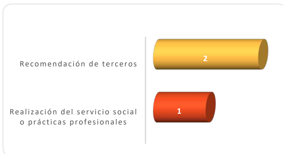
Gráfica 2.1 Medios de reclutamiento más utilizados por los empleadores

La Gráfica 2.1 muestra los medios de reclutamiento para el proceso de contratación observándose que el mayormente utilizado por los empleadores y/o personal de recursos humanos es a través de la recomendación de terceros, debido a que 2 de los 3 empleadores así lo manifestaron. La realización del servicio social y las practicas profesionales es otro medio de contratación mencionado por 1 de ellos.