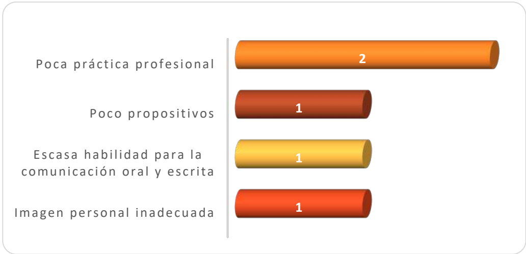
Gráfica 2.3 Principales debilidades de los egresados al momento de la contratación