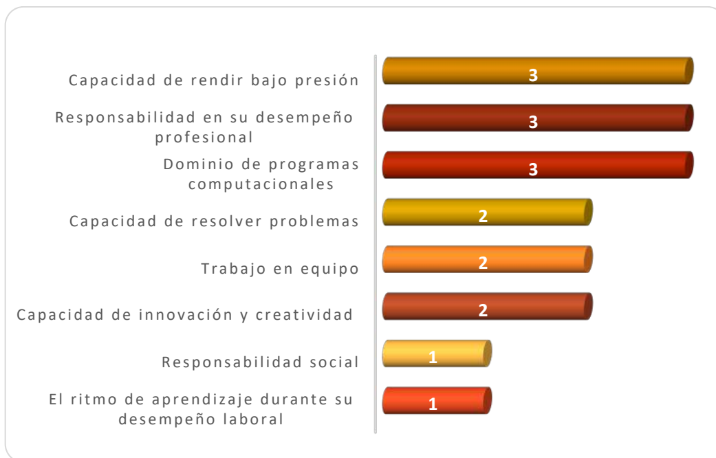
Gráfica 3.1 Aspectos más importantes que poseen los egresados de esta licenciatura, considerados por los empleadores