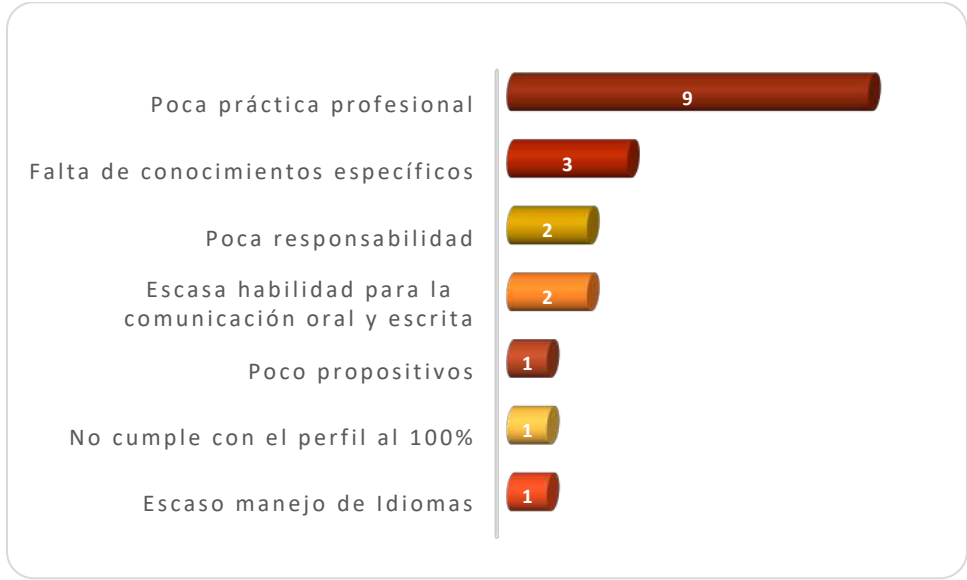
Gráfica 2.3 Principales debilidades de los egresados al momento de la contratación