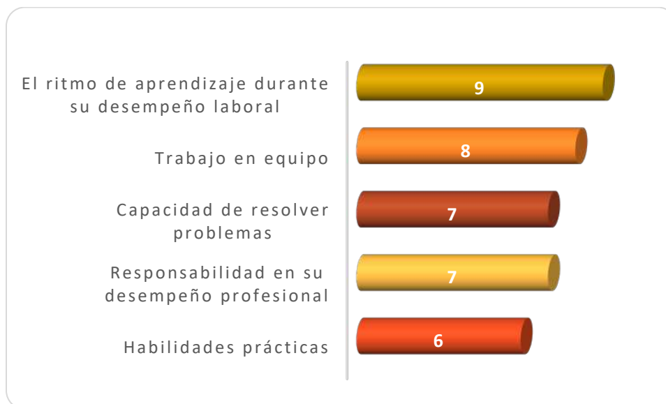
Gráfica 3.1 Aspectos más importantes que poseen los egresados de esta licenciatura, considerados por los empleadores

problemas indicado por 7 empleadores de forma respectiva. Finalmente 6 señalaron las habilidades prácticas como se muestra en la Gráfica 3.1.