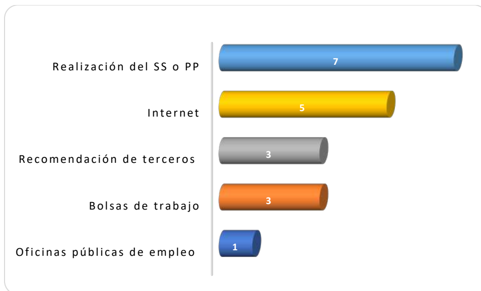
Gráfica 2.1 Medios de reclutamiento más utilizados por los empleadores

La Gráfica 2.1 muestra los medios de reclutamiento para el proceso de contratación observándose que el mayormente utilizado por los empleadores y/o personal de recursos humanos es a través de la realización del Servicio Social y Prácticas Profesionales, lo anterior debido a que 7 de las 12 empresas así lo manifestaron. El internet es otro medio utilizado por 5 de las empresas que contestaron la encuesta. La recomendación de terceros y la bolsa de trabajo seleccionado por 3 empresas respectivamente, en tanto que una empresa lo realizó a través de las oficinas públicas de empleo.