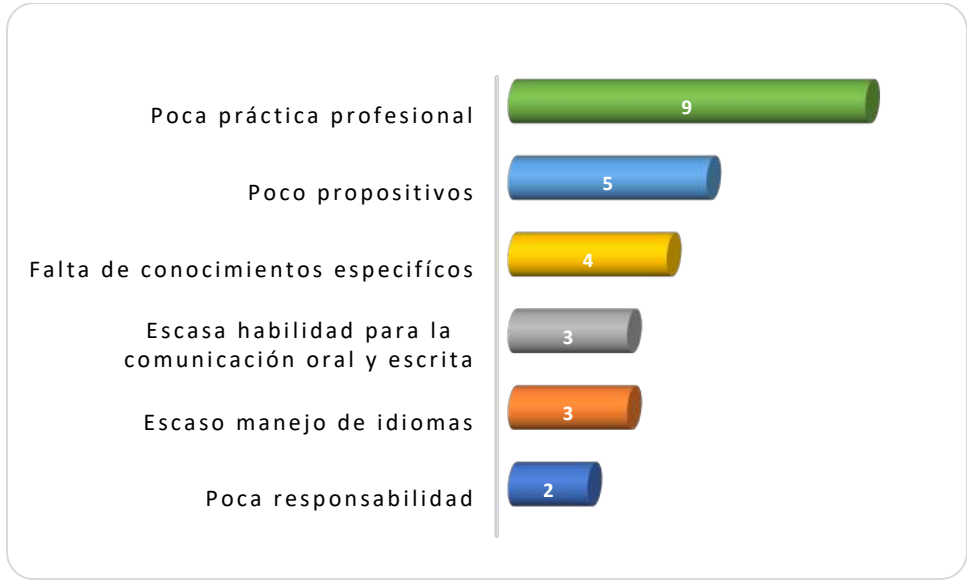
Gráfica 2.3 Principales debilidades de los egresados al momento de la contratación