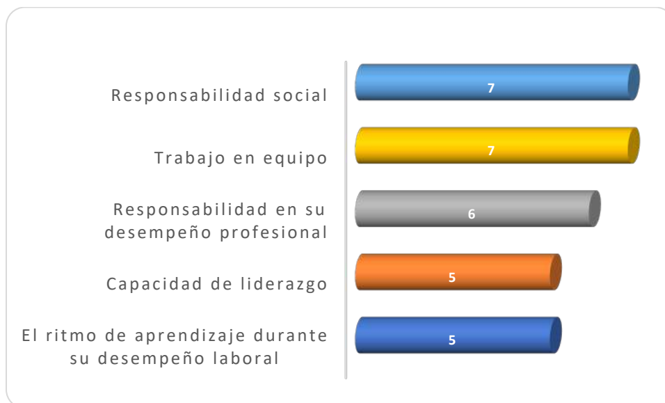
Gráfica 3.1 Aspectos más importantes que poseen los egresados de esta licenciatura, considerados por los empleadores

profesional señalado por 6 de ellos. 5 destacaron la capacidad de liderazgo y el ritmo de aprendizaje durante su desempeño laboral como se muestra en la Gráfica 3.1.