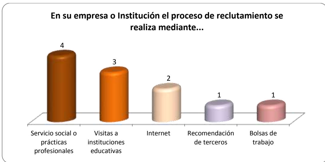
Gráfica 2.1 Medios de reclutamiento más utilizados por los empleadores y sus frecuencias de uso

A continuación en la Gráfica 2.1 tenemos 5 opciones que se utilizan como indicadores para observar los medios más frecuentes de reclutamiento, donde se observa que el servicio social o prácticas profesionales es el más utilizado por los empleadores.