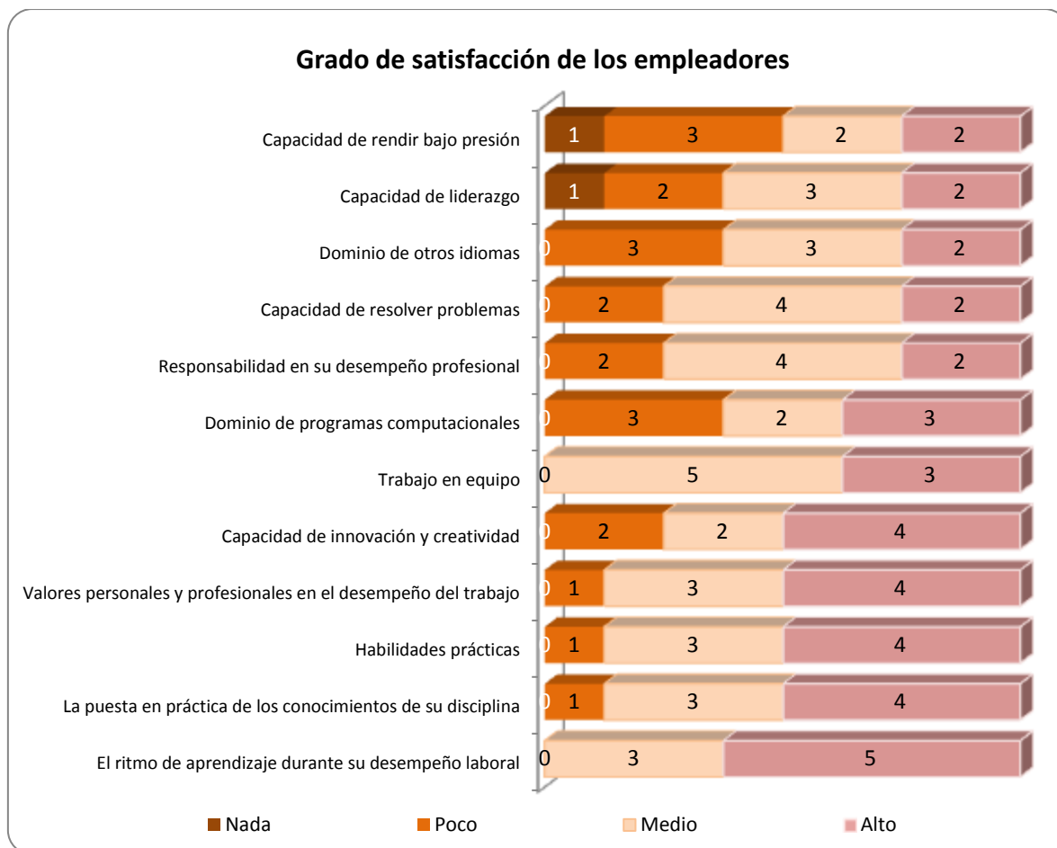
Gráfica 3.1 Frecuencias y grado de satisfacción asignados por los empleadores